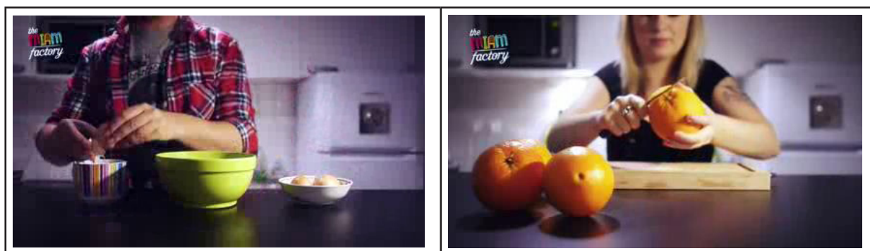
Figuras 4 e 5 – Ausência do rosto e distorção do foco do apresentador na série The Miam Factory . 20

A figura do apresentador em programas de culinária e gastronomia na TV nos remete à importância da oralidade e de sua pertinência no ambiente midiático: “[é] a voz funcionando em conjunto com as imagens que ativa os diversos lugares de possibilidade de diálogo da televisão com o público” (BARBOSA, 2007, p. 6). Na web, contudo, mesmo que tenhamos bastante presente a tentativa de acomodação da figura de um apresentador, ao que parece, outra forma de sua abordagem da receita vem se desenvolvendo. Em algumas produções recentes, como é o caso da série The Miam Factory 19 , a voz já não parece ser necessária, e da mesma maneira o rosto que apresenta a receita (Figuras 4 e 5): o apresentador na web, além de aparentemente não precisar mais ter uma voz, quando tem um rosto, está por vezes desfocado – enquadramentos com apenas as mãos, ou ainda sem evidência visual de alguém que executa a receita têm se mostrado cada vez mais comuns em vídeos de receitas culinárias na web. Se a internet não pressupõe exatamente relação com um público (é uma interação direta), o rosto e em especial essa abordagem da oralidade na web podem não ter a mesma validade que na televisão, o que parece se traduzir no aumento do número de vídeos de receitas produzidos para a web que exploram outras expressões de imagem e som como alternativas para a presença do apresentador (ou narrador), e da oralidade.