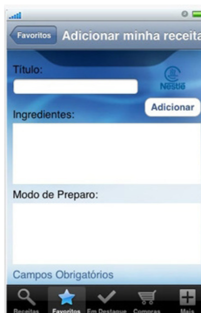
Figura 3 – Aplicativo de receitas da marca Nestlé, com campos padronizados a serem preenchidos pelo consumidor/usuário. 12

Partindo do entendimento de Wolton, ao pensarmos no uso que já se faz das tecnologias digitais e da internet, não há como negar a tendência à integração de atividades, antes distintas, num mesmo suporte (ainda que pressuponham um diferente lugar cultural): a “mudança não é somente técnica, é também cultural, uma vez que não haverá mais diferenças entre atividades separadas durante séculos” (WOLTON, 2012, p. 94). Isso provavelmente se deve à observação fundamental feita pelo autor de que “as mídias encontraram sua inscrição social e cultural enquanto que as novas tecnologias ainda não ” (WOLTON, 2012, p. 96, grifo nosso).