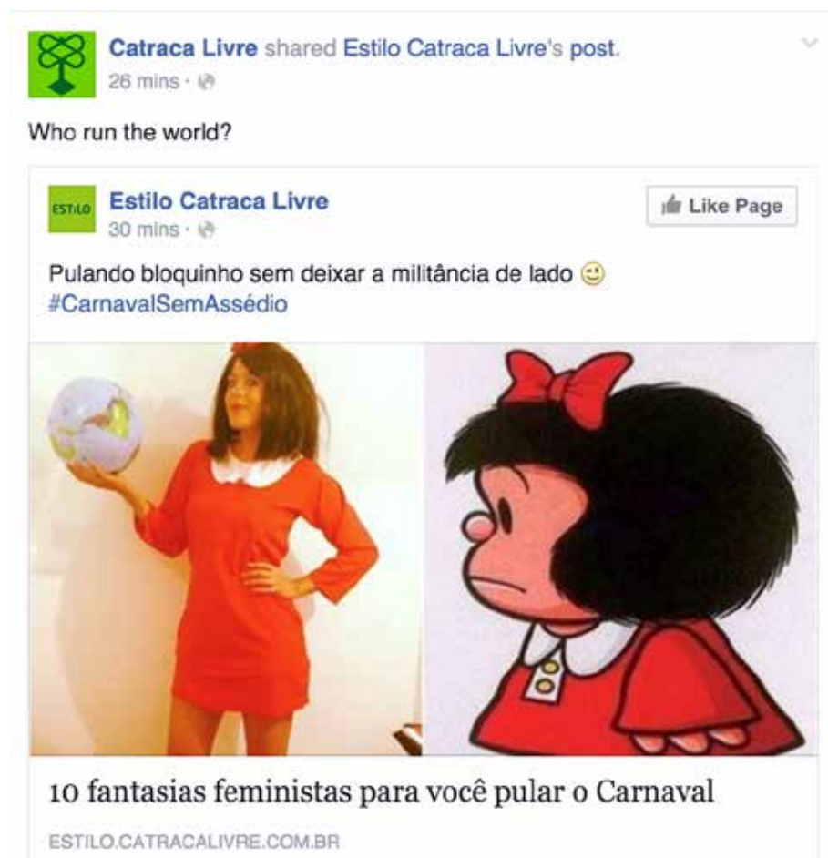
Figura 1: Imagem de conteúdo do site Catraca Livre

Outro ponto que vale ser destacado aqui são os formatos de conteúdo que vêm ganhando visibilidade e notoriedade por parte dos usuários das plataformas de mídias sociais. Trata-se dos conteúdos curtos, enxutos e baseados em listas, hierarquias, efemeridades, ponto que discutiremos a seguir e que exemplificamos com a Figura 1.