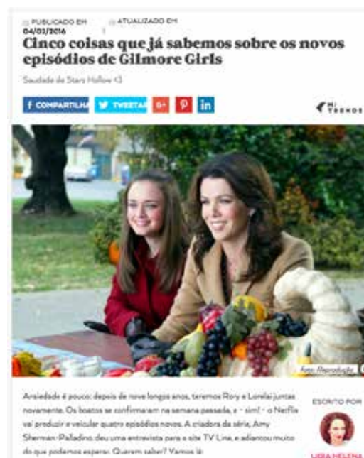
Figura 2: Imagem de conteúdo do site M de Mulher sobre o seriado de TV Gilmore Girls