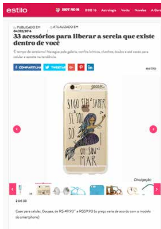
Figura 4: Imagem de tela do site M de Mulher sobre acessórios