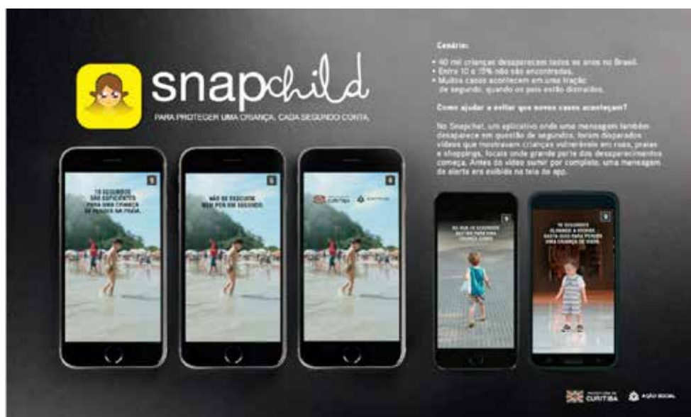
Figura 6: Campanha Snapchild promovida pela Prefeitura de Curitiba em seus perfis de mídias sociais

interesse. Nessa linha de raciocínio, porém utilizando-se do recurso de maneira muito criativa, está a Prefeitura de Curitiba – mais comumente conhecida por Prefs pelos membros de suas redes sociais –, que se valeu do aplicativo Snapchat para conscientizar as pessoas sobre o desaparecimento de crianças. O aplicativo caracteriza-se por apagar seus conteúdos em determinado curto período de tempo. Essa lógica foi aplicada à campanha Snapchild (vide Figura 6): “bastam dez segundos de distração para que uma criança desapareça”.