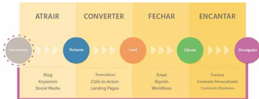
Figura 7: Metodologia do inbound marketing , segundo a HubSpot

Em linhas gerais, o inbound marketing pode ser assim resumido: