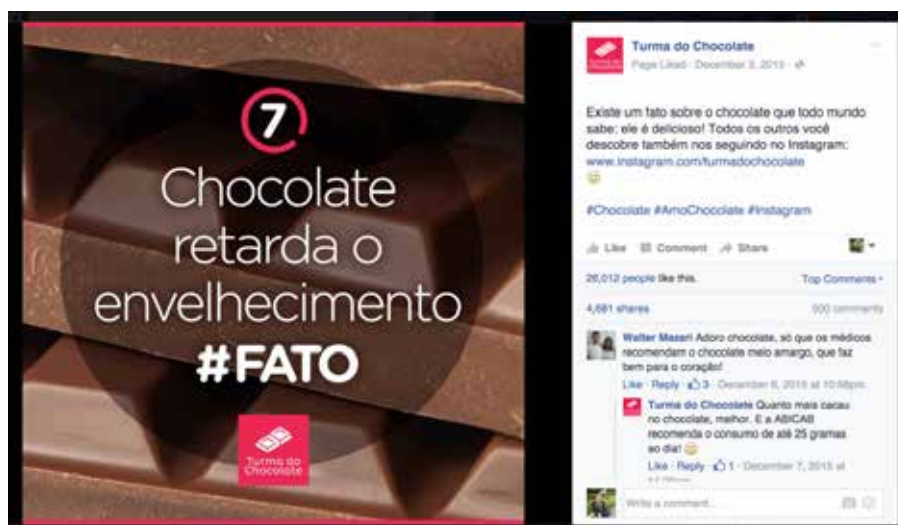
Figura 5: Imagem de conteúdo da fanpage da Turma do Chocolate