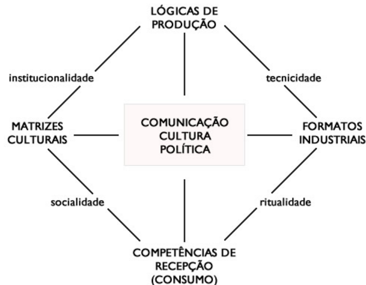
Figura 1: Mapa das Mediações.

O mapa é apresentado graficamente através de um círculo (ou circuito):