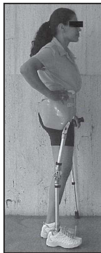
Figura 2 CCS em P / Prótese (joelho recurvado)

principalmente às custas de prejuízo nas áreas motoras (MIF motora = 40). Com o início da reabilitação houve incremento de 210% no componente motor da MIF, que se manteve até a última avaliação. Os parâmetros da MIF cognitiva mostraram-se estáveis e máximos durante todo o acompanhamento. A discreta queda dos escores da MIF na última avaliação, referentes a alimentação, higiene pessoal e banho, dizem respeito às dificuldades impostas pelo uso e cuidados com a prótese, que tornam tais atividades mais lentas e trabalhosas (Tabela 1).