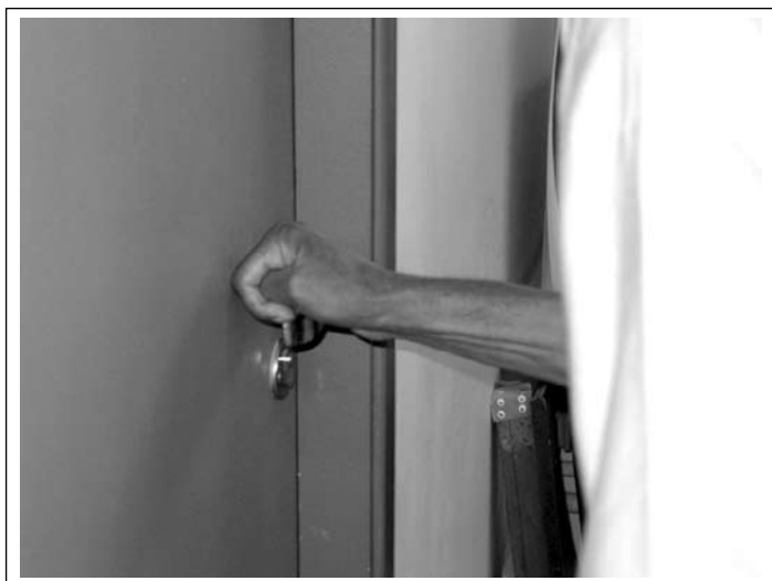
Figura 6 Função de abrir a porta com mão fechada.

sasse 40 minutos, soma das 4 tentativas de 10 minutos, evitando-se a possibilidade de fadiga e ansiedade para os pacientes.