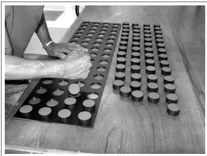
Figura 1 Encaixe das peças realizado com a borda ulnar da mão.

Ao estipularmos a espera de 10 minutos (600 segundos) para cada tentativa, e contabilizarmos o número de peças encaixadas pelo paciente, garantimos que o tempo máximo de espera não ultrapas-