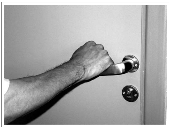
Figura 5 Função de abrir a porta com encaixe da mão na maçaneta.