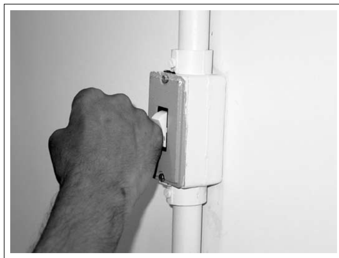
Figura 7 Função de manipular interruptor com mão fechada.