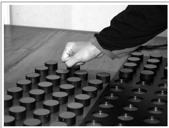
Figura 2 Deslizamento das peças realizado com o dorso dos dedos e mão fechada.