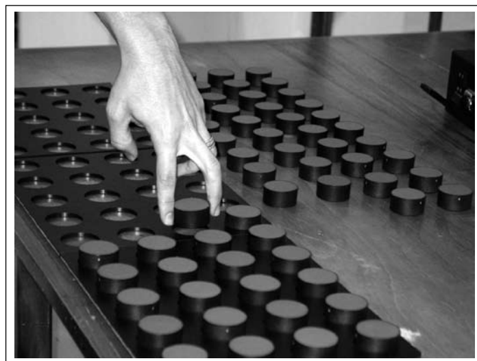
Figura 4 Encaixe das peças realizado com prensão entre II e III dedos.