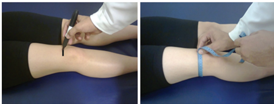
Figura 1. Procedimento padronizado para a avaliação da circunferência do joelho