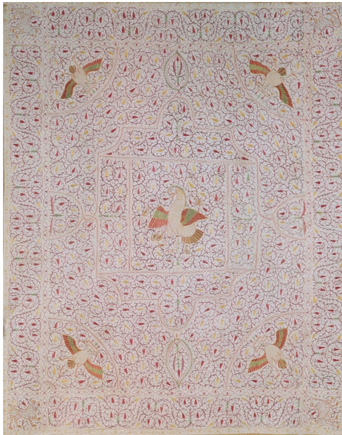
Figura 5 – Colcha indo-portuguesa. Primeiro quartel do século 17. Fonte: MNAA (1945, 1978b). 50