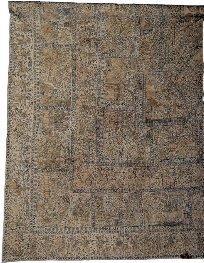
Figura 3 – Colcha indo-portuguesa do século 17. Algodão e seda. 15

equilíbrios entre espaços e separando salas; e, ainda, de colchas indianas e indo-portuguesas de diversas origens e qualidades que cobriam camas e forravam, por exemplo, os dosséis dos leitos e a armação das liteiras. É verdade que sobre a questão da serventia e da função a que se destinavam os objectos, os principais especialistas na matéria entendem que são as grandes dimensões dos panos de armar ou guarda-portas e sobretudo os assuntos que neles aparecem representados que os distinguem das colchas. As colchas definir-se-iam, então, por serem enormes tecidos bordados, e cujo significado corresponderia à sua função. 16