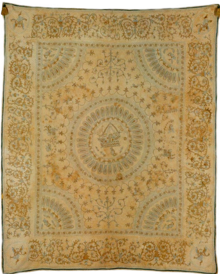
Figura 1 – Colcha indo-portuguesa do século 17. Fonte: MNAA (1978). 11

De igual modo, a rainha terá demonstrado interesse no modo de produção dos têxteis e dos bordados indianos de qualidade. Talvez isso explique o motivo pelo qual, entre as encomendas e os presentes que Afonso de Albuquerque lhe trazia da Índia em 1511, se contavam muitas mulheres extraordinariamente hábeis na costura e tecelagem. 10 Lamentavelmente, nessa viagem de regresso de Malaca para Lisboa a nau Flor do Mar naufragou, tendo-se afogado as infelizes bordadoras indianas. Para a história ficou, no entanto, o enorme apreço que D. Maria e as cortes europeias nutriam pelo bordado indiano (figura 1).