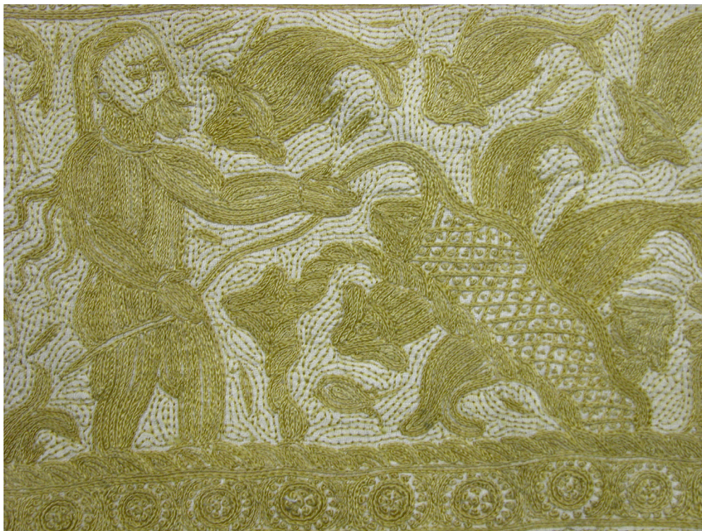
Figura 8 – Colcha (detalhes) indo-portuguesa, c. 1600. 76