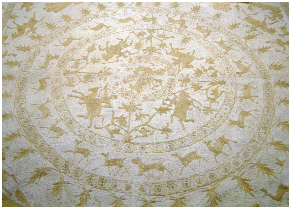
Figura 4 – Colcha indo-portuguesa. c. 1600. 36

Em termos genéricos, pode-se dizer que alguns objectos de exibição pública, como jóias e outras peças acessórias de vestuário, tendem a ser comprados mais pelo seu aspecto emblemático do que pelo bem-estar e prazer que proporcionam, na medida em que são artigos de ostentação, para serem exibidos aos demais. De igual modo, alguns artigos de uso privado, nomeadamente os objectos de decoração e conforto do lar – entre os quais se contam móveis, tapetes, colchas indo-portuguesas e outras fazendas asiáticas usadas para revestir paredes e adornar pisos –, eram geralmente adquiridos pela comodidade e pelo deleite que proporcionavam não só aos proprietários, mas também a um grupo reduzido de pessoas que pertencia ao círculo íntimo da casa.