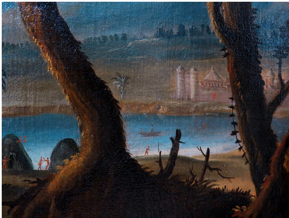
Figura 3 – Detalhe da numeração 7, 8 e 11, indicando os lugares da tela.

O texto enigmático e memorial liga-se ao figurado por meio de uma numeração (Figura 3) que sugere ao espectador um circuito entre os lugares que compõem a vida do padre. Seguindo a numeração da tela em suas quase ilegíveis marcas de tinta vermelha, e levantando hipóteses de natureza iconográfica, essas são as referências acerca dos lugares assinalados.