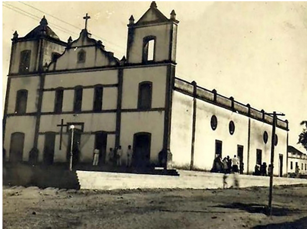
Figura 4 – Igreja-matriz de São João Batista e N. Sra. da Conceição.