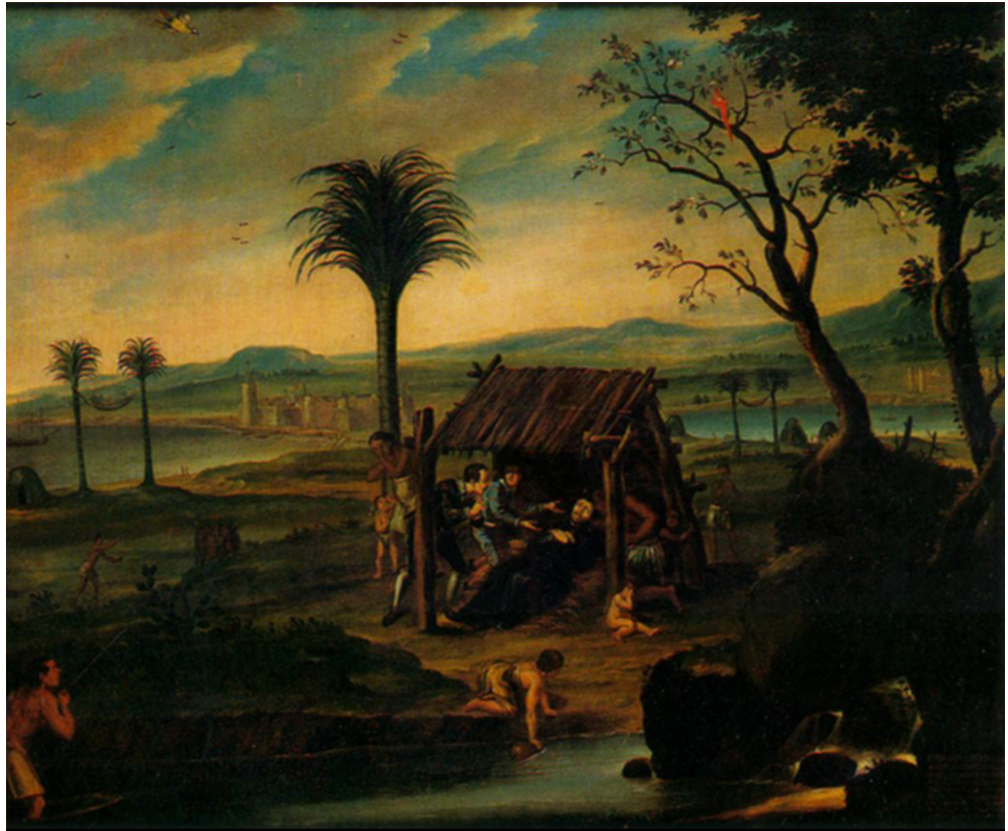
Figura 1 – Autor desconhecido. Morte do padre Filipe Bourel , 1701/1800, óleo sobre tela, 110,5 x 133,5 cm. Sem assinatura. Coleção Museu Nacional de Belas Artes/Ibram/Ministério do Turismo. 6

Coli, historiador da arte ligado ao Museu Nacional de Belas Artes do Rio de Janeiro e à Universidade de Campinas (Unicamp), analisou a iconologia da pintura, ocupando-se de seu lugar como obra de arte e ampliando sua visualidade.