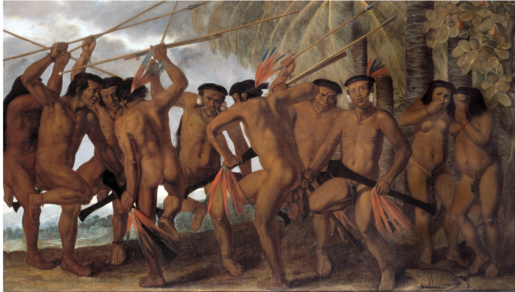
Figura 6 – Dança dos Tarairiu (Tapuias).

A correspondência missionária também apresenta relatos de grande visualidade, como a do padre Andreoni, que na mesma carta de 1706 descreve os tapuias Janduim de modo especulativo, sem se render a um exotismo puro e simples: