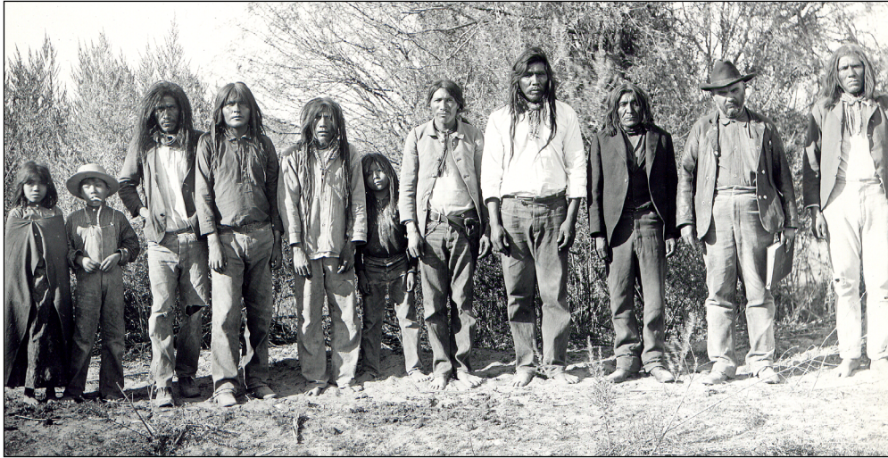
Figura 7 – Grupo de indígenas Cucapá posando para una fotografía a lado de un norteamericano. C. 1900.

Asimismo, aunque permaneció una idea generalizada sobre cómo eran y cómo vivían los distintos grupos asentados en el norte de México, las distintas delimitaciones fronterizas que se hicieron después de la independencia y, concretamente, después del Tratado de Guadalupe Hidalgo, y cómo fueron narradas y leídas desde el proyecto nacional mexicano, redefinieron la idea del contacto entre éstos a través del entendido del mestizaje, es decir, de individuos que fueron categorizados dentro de una jerarquía social basada en las razas (Figura 7). Por lo tanto, además de hacer referencia a los indígenas neófitos y los no evangelizados, también se hizo mención, en la jerarquización categórica, al contacto entre indígenas y población ya mestiza, donde se resalta el papel de los soldados quienes representaban la “mezcla” entre los grupos “nómadas evangelizados” y los mestizos.