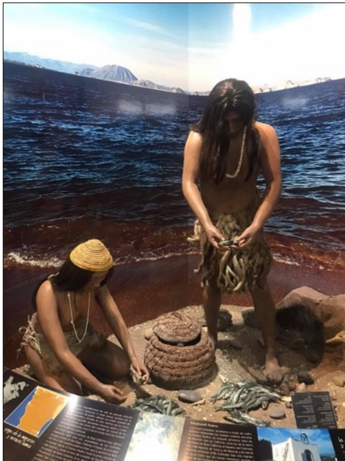
Figura 4 – Diorama de la Migración Temprana en zona Costa. Colecta del pejerrey y organización Kumiai.

Uno de los temas que sobresalen para interpretar la historia contemporánea es el de las migraciones, resaltando la de los grupos nativos, tanto antes de la conquista como las coloniales y las contemporáneas (s. XIX y XX). Estas migraciones suelen narrarse de manera evolutiva y lineal, es decir, como se planteó en el primer apartado de este artículo, el desarrollo de las poblaciones se explica, entre otras cosas, por la geografía y el medio ambiente, la organización social (concretamente que pasa del nomadismo al sedentarismo), los cambios en la fisonomía, así como un entendido del progreso que es justificado por el adelanto tecnológico. Linealidad que va de lo simple a lo complejo y de menor a mayor valor, sustentándose en una visión histórica que versa en la lógica de la modernidad.