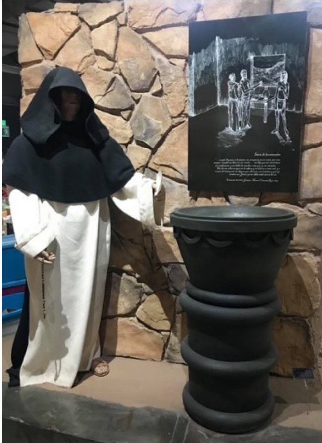
Figura 6 – Inicio de la conversión.

La misión civilizadora partía de la idea de que la naturaleza (del territorio desértico y agreste) y los indígenas debían domesticarse para alcanzar el desarrollo, es decir, “llegar a lo más avanzado de la especie humana”, representada en el modelo moderno/occidental o en la idea evolucionista de Charles Darwin. Esta visión, como planteó Aníbal Quijano, se sustentó en: a) un dualismo (europeo/no europeo, salvaje/civilizado, naturaleza/cultura y tradicional/moderno) y un evolucionismo que se interpretó de manera lineal, desarrollista y homogénea; y b) una biologización de las diferencias culturales entre distintos grupos humanos, por medio de su clasificación basada en razas, que retomaron y se articularon con el modelo evolucionista. 53