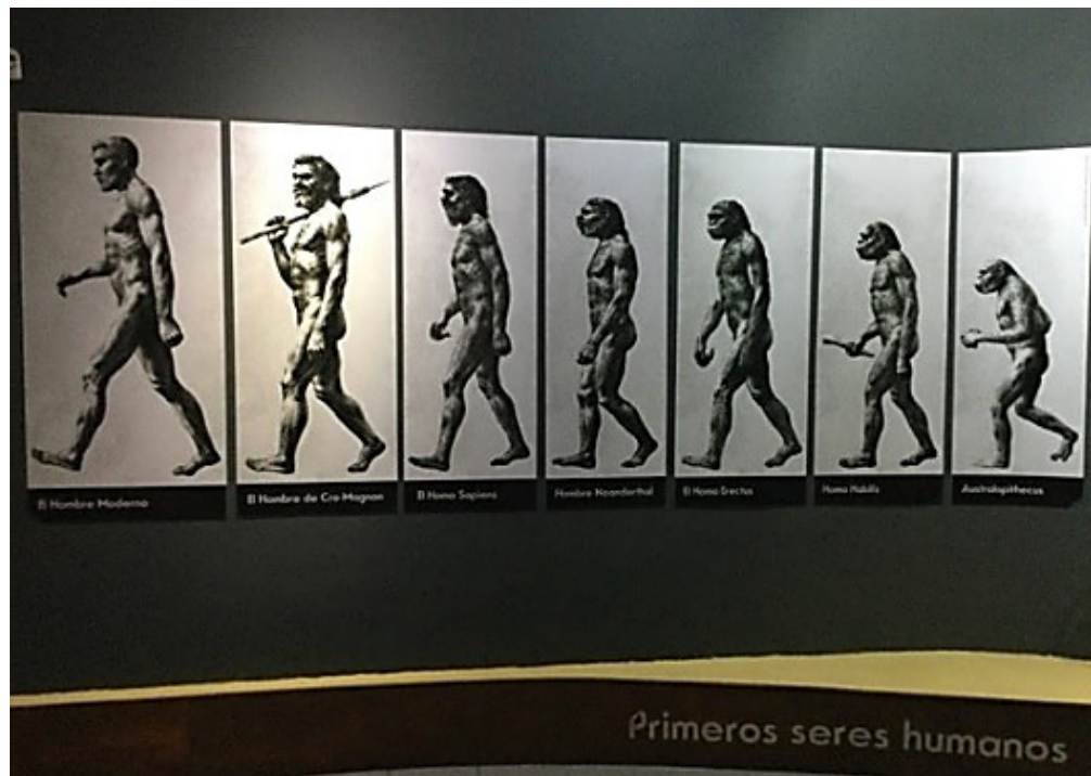
Figura 1 – Primeros seres humanos.

A finales del siglo XX, como se mencionó antes, se dio una crítica al concepto de cultura desde la subalternidad, que giró en torno al entendimiento elitista y homogéneo de dicho concepto, lo cual propició que en los museos se generaran narrativas que presentaban a los “otros”, en este caso, de la historia nacional. Sin embargo, la alegoría de las diferencias propició, por un lado, que la representación de la historia en los museos se “sometiera a una estetización de lo subalterno”, es decir, se amplió la fetichización de lo considerado “otro” 29 del proyecto nacional. Por otro lado, el entendimiento de la subalternidad llevó a que las diferencias sociales se explicitaran y argumentaran a través del cuerpo y lo territorial, como se verá más adelante.