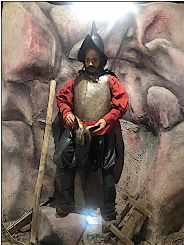
Figura 5 – Migración Colonial. Fuente: Exposición Permanente Desierto, Migración y Frontera. Sala 3. Historia y Antropología, IIC-Museo UABC. Fotografía del autor.

49. La fantasía en torno a la península que llamaron California , Museo de las Californias (2000).