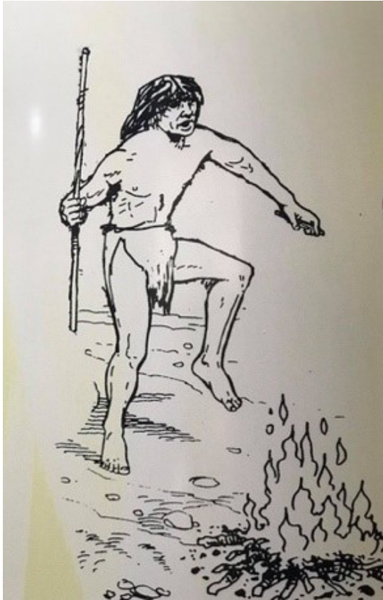
Figura 3 – Creech en el Holoceno Temprano.

En la identificación o desidentificación cultural que se hace en los museos en cuanto a los grupos Yumanos, se retoman, reinventan y exaltan características físicas y morales y su relación en una determinada población. Entre ellas podría mencionar: la adaptación al medio hostil, la migración del sur, el trabajo constante por la tierra y el progreso tanto de los grupos sociales como del territorio. Físicamente, se habla de cuerpos fuertes, altos, robustos y ágiles elementos que explican las diferencias físicas de estas poblaciones frente a otras del centro-sur de la nación, las cuales son justificadas por el ecosistema (Figuras 2 y 3).