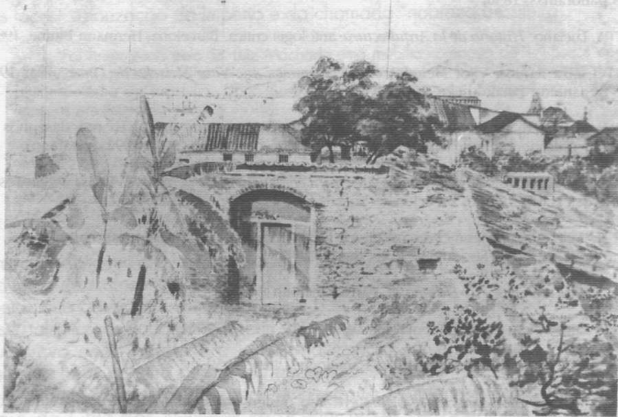
Fig. 2 - William John Burchell (1781-1863). O mais belo panorama do Rio de Janeiro (detalhe), 1825. Bico de pena e aquarela.