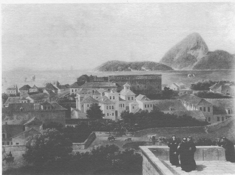
Fig. 3 - Nicolas - Antoine Taunay (1755-1830). Morro de Santo Antonio , 1816. Óleo sobre tela, 46,5x57,4 cm. Museu Nacional de Belas Artes, Rio de Janeiro.