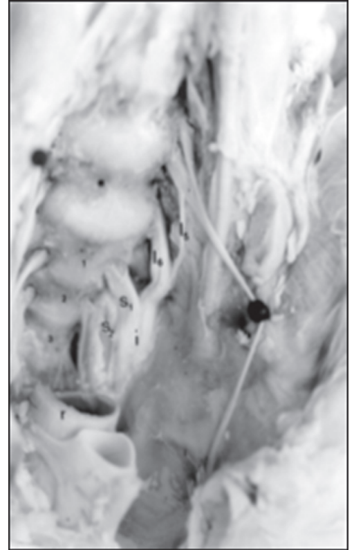
Figura 2 - Cavidade pélvica de feto bovino: vista ventro-lateral esquerda do osso sacro evidenciando as raízes ventrais do 5º ( L_5 ) e 6º ( L_6 ) nervos lombares e 1º ( S_1 ) e 2º ( S_2 ) nervos sacrais confluindo para a formação do nervo isquiático (i). r: reto, 1, 2 e 3: primeira, segunda e terceira vértebras sacrais, respectivamente. Observar que a contribuição dada pelo 2º nervo sacral é menor que a do 5º nervo lombar

A dissecação das peças anatômicas além de permitir identificar as várias contribuições à formação do nervo isquiático também possibilitou a verificação de proporções diferenciadas entre elas. Sendo assim, na formação do nervo isquiático, os ramos ventrais do 6º nervo lombar e 1º