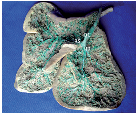
Figura 2 - Fotografia do fígado de Avestruz, cujas vias bilíferas foram injetadas com Látex corado em verde, seguindo-se de fixação do parênquima hepático em solução de formol a 10% e a seguir dissecadas pela face visceral onde identificamos: DC- ducto colédoco; resultando da confluência do RS- ramo principal esquerdo e RD- ramo principal direito – Araçatuba-2005