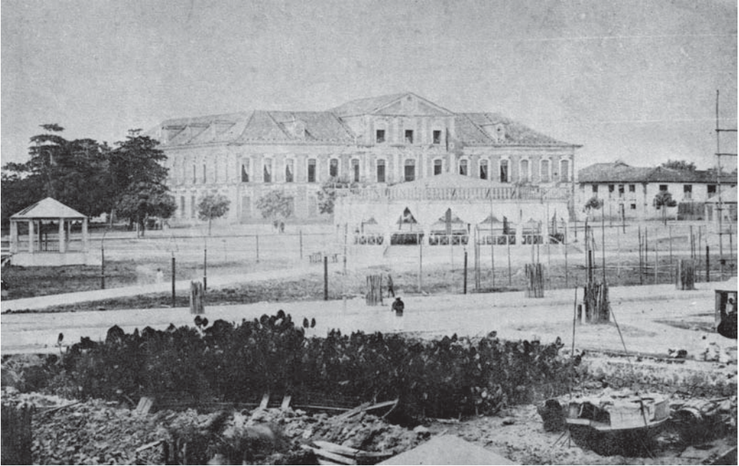
Fotografia de 1867 por ocasião dos festejos da abertura do rio Amazonas ao comércio mundial.