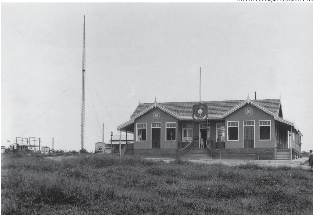
Prefeitura de Rio Branco (Acre), dezembro de 1912.

Certamente, no caso da Amazônia, o rótulo de região atrasada tem sido foco de desastres. É aqui que reside o problema. Especialmente porque se há uma região brasileira que melhor conheça a experiência da modernidade, esta é a Amazônia, como prova a sua própria história. Nos quinhentos anos de presença da cultura europeia, experimentou os métodos mais modernos de exploração. Cada uma das fases da história regional mostra a modernidade das experiências que foram se sucedendo: agricultura capitalista de pequenos proprietários em 1760 com o Marquês de Pombal, economia extrativista exportadora em 1890 com a borracha, e estrutura industrial eletroeletrônica em 1970 com a Zona