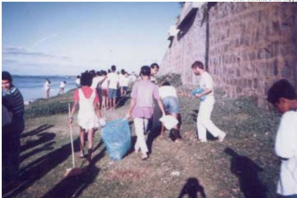
Mutirão de limpeza nas margens do Velho Chico.