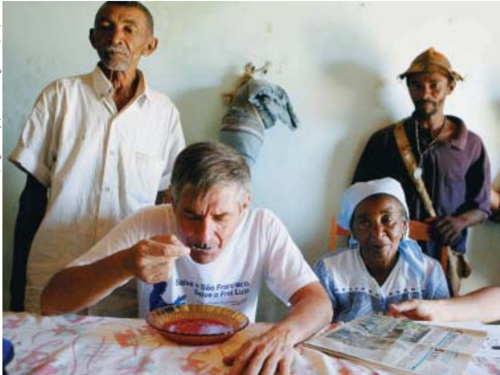
Dom Cappio toma caldo de galinha, após suspender a greve de fome.

visitar para saber como eu estava sendo tratado. Não posso reclamar porque fui bem acompanhado, sendo alvo de muito carinho e cuidado.