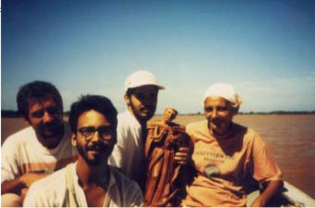
Os quatro participantes na peregrinação de 1992.

A fome – Quando fomos de Barra do Pacuí (município de Ibiáí) para Ponto Chic (município de Ubaí), a uma certa altura a chuva impossibilitou a continuidade da caminhada e nos abrigamos em uma casa próxima ao Riacho da Fama. Eram 15h00 e esta família não tinha nada além de pequi para o almoço (fruto generoso do cerrado). Até a farinha tinha acabado. Em muitas comunidades fomos hospedados por famílias de pescadores que dificilmente comem do peixe que pescam. Normalmente o dono do armazém local é também o ‘atravessador’ do peixe, e os pescadores, pressionados por dívidas que nunca têm fim, repassam diretamente a este todo o fruto de seu trabalho. Ouvimos em Palmeirinha, município de Pedras de Maria da Cruz, este bendito entoadado por um povo familiarizado com a doença, a fome e a violência: