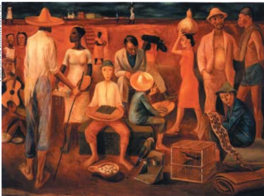
São Francisco (óleo s. tela, 60 x 83 cm, 1939), obra do artista Carybé.

do sertão. Falamos a eles que o rio é um presente de Deus para vida de todos. E que, antes de colocar o povo nessa região, Deus colocou o rio. Essa linguagem mística o povo entende. Outro objetivo da caminhada era fazer um grande diagnóstico, era identificar as grandes causas da morte do rio, porque observamos como o rio está morrendo. Nosso objetivo último era dizermos para os ribeirinhos que eles são os zeladores do rio e que tinham de assumir essa missão, já que nenhum estranho cuidaria disso. Dávamos exemplos concretos e simples de cuidados com as árvores – plantamos mais de um milhão de mudas – e de como não poluir o rio. Essa viagem