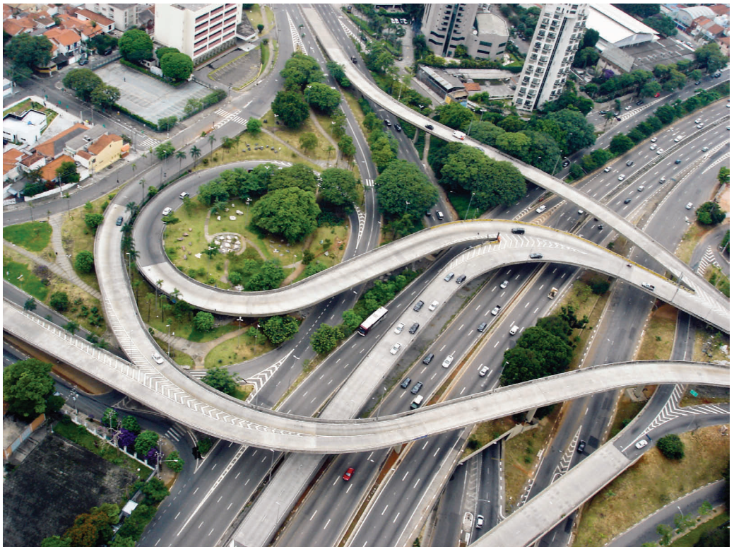
No alto, exemplo da verticalização sem limites em bairros assobradados: condomínio murado com equipamentos coletivos próprios. Embaixo, a cidade do automóvel.