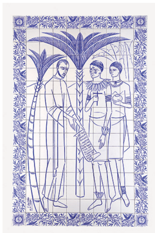
Figura 9 – Anchieta e Nóbrega – capela/piroga.