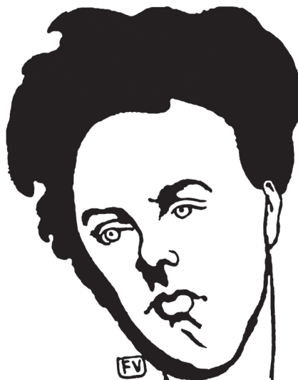
Arthur Rimbaud (1854-1891).

a linhagem de escrita aqui ressaltada. A começar pelo reconhecimento de que assumem um formato próximo do comentário, da anotação íntima ou casual, em que predomina a naturalidade discursiva. Nesses textos a propriedade dos argumentos e das rumações revela-se tão importante quanto as imagens evocadas; pensamento e visualidade articulam-se numa só dicção.