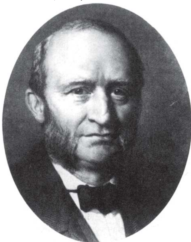
Ernst von Brücke

O mentor seguinte, na universidade, foi o grande fisiólogo Ernst von Brücke, em cujo laboratório Freud encontrou plena satisfação, admirando e procurando imitar o mestre. Aí conheceu Josef Breuer, 15 anos mais velho e já renomado neurólogo (por ter descrito, juntamente com E.Hering, o reflexo respiratório que leva o nome dos dois). Breuer iria, como se sabe, trazer a Freud a sua primeira paciente (Ana O, caso fundador da PA). Entre 1876 e 1885, Freud ocupou-se de questões de neurofisiologia comparativa, disso resultando o seu segundo trabalho científico (“Sobre a origem da raiz nervosa posterior na medula de Ammocoetes” – larva do peixe lampréia, também publicado nos SA Akad , Wien, 1878) e depois estudos sobre o sistema nervoso do lagostim. Preferia, então, esse tipo de investigação ao tratamento de pacientes, atribuindo-se a isso o fato de ter levado