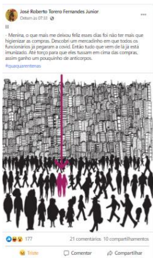
Figura 5: Print de III (série Quaquarentenas)