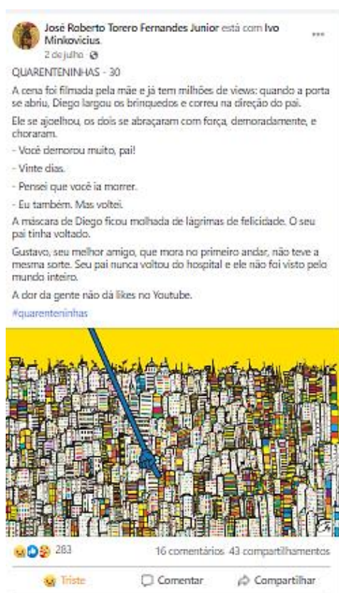
Figura 3: Print de Quarenteninhas - 30