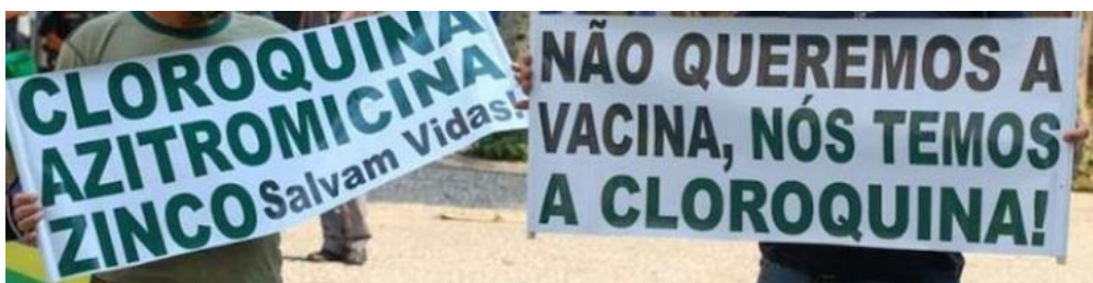
Figura 7: Imagem de manifestantes antivacinação (editada pelo autor para não identificar os sujeitos da foto).