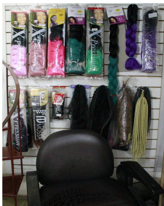
[ Figura 6 ] Jumbos coloridas e monocromáticas