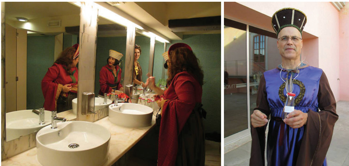
[ Figura 8 ] À esquerda, as rainhas preparando as garrafas de vidro recicladas para a performance. À direita, um dos participantes com o vestido de rainha, a coroa e a garrafa de água com a etiqueta branca onde cada participante escreveu uma palavra positiva