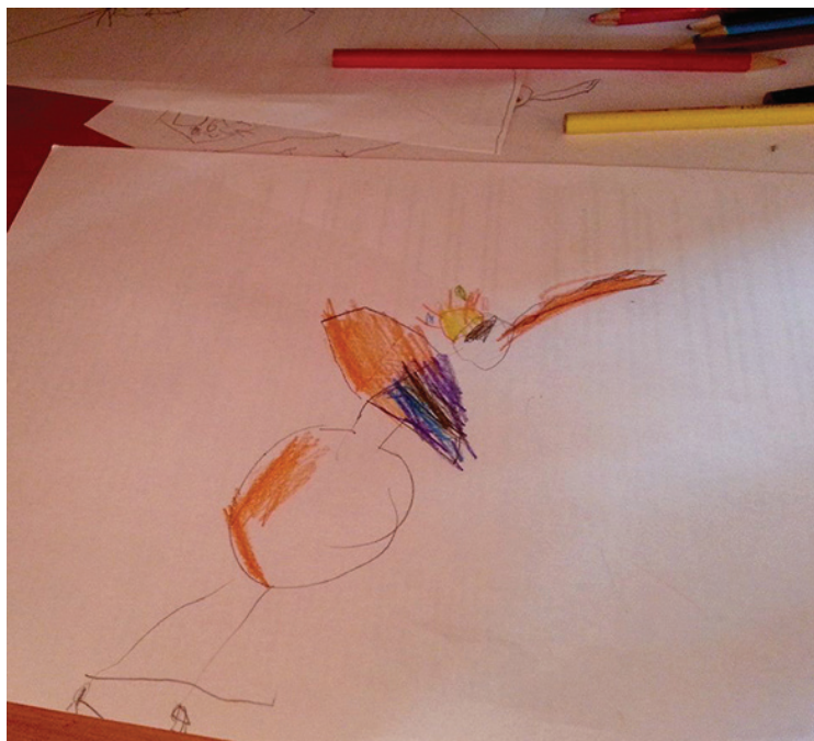
[ Figura 10 ] Desenho de Daniel (5 anos), "A cegonha-rainha"