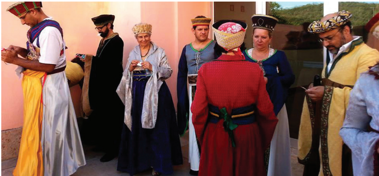
[ Figura 6 ] A preparação ritualística do Cortejo das Rainhas