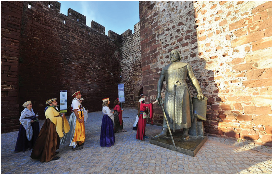
[ Figura 9 ] As rainhas despejam água na estátua do rei