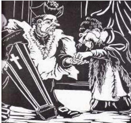
A Lanterna, São Paulo, 07 de março de 1935, nº 387, p.1.

A Lanterna lança mão deste recurso comum na prática libertária, mas em todas as charges a temática é anticlericalismo, ora de ataque direto a Igreja Católica, ora vinculando a Igreja ao Estado 22 . Não foi possível, até este estágio da análise, estabelecer uma relação direta do texto com a imagem.