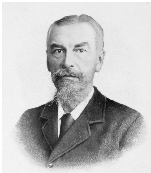
Figura 1. Retrato de Philip Lutley Sclater (1829-1913).

O objetivo deste artigo é discutir sobre a proposta de Sclater no contexto da biogeografia do século XIX, procurando detectar que aspectos foram aceitos ou modificados por Wallace.