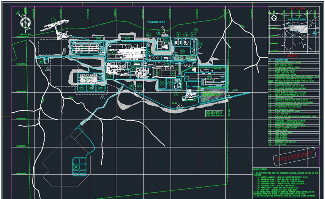
Figura 1. Caso 1: Planta geral do projeto.