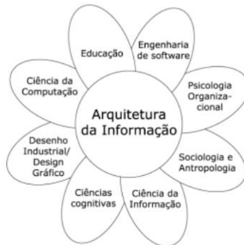
Figura 01 – Relações da arquitetura da informação com outras disciplinas Fonte: Dillon, 2001 2 apud Agner e Silva, 2003.

Como é ilustrado na figura 01, a arquitetura da informação é um campo interdisciplinar que interage com várias outras disciplinas tais como usabilidade, design de interação, experiência de usuário, entre outros. Dessa forma, parece unificar em torno de sua proposta teórica diversas abordagens que devem ser levadas em consideração quando da análise do fenômeno de se pensar e produzir um sistema de informação.