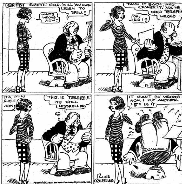
Figura 1 - Tillie the Toiler, de Russ Westover, fue una de las primeras protagonistas de comic strips, trabajadora e independiente, cuyas peripecias iban dirigidas a un público masculino.

3. Hay que advertir que alfabetización no debe ser equiparada con hábitos lectores. En realidad no se tuvo un conocimiento fundamentado de los hábitos de lectura de los españoles hasta la primera encuesta científica realizada por el Instituto Nacional de Estadística en 1974, en la cual se preguntaba por la lectura por primera vez a personas de sexo femenino (y con el universo restringido a las mayores de catorce años).