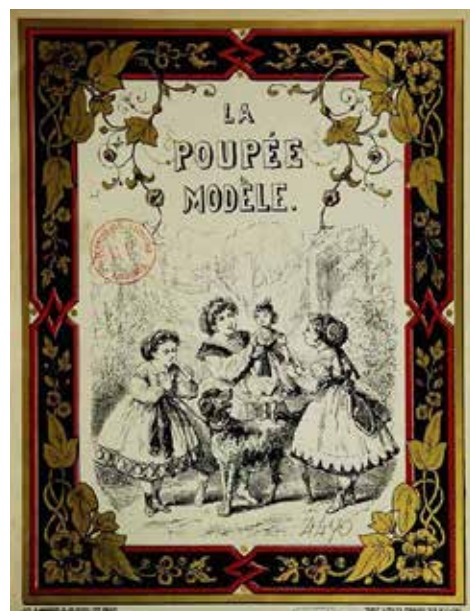
Figura 2 - La Poupée modèle fue una revista francesa en la que se inspiraron los editores españoles para crear revistas dirigidas a las niñas.

Las publicaciones gráficas dirigidas a las niñas se vieron en Europa antes que en América debido a que ya existía una tradición de prensa destinada a los más pequeños, muy ilustrada y presente en los quioscos desde los últimos años del siglo XIX. En Francia eran habituales las llamadas magazines illustrées , algunas de las cuales llevaron viñetas o historietas dirigidas a las niñas, como fue el caso de La Poupée Modèle (Figura 2), título que