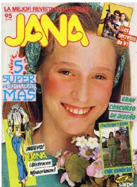
Figura 11 - La jovencita ideal de los años ochenta, representada en la revista Jana, quería ser sofisticada, ir a la moda y estaba atenta a los ideales heroicos y a los ídolos de la televisión y el cine.

y el sentimentalismo parecía inamovible; o ella se rendía a esa condición humillante o bien elegía la vía de la villanía para terminar convirtiéndose en un “monstruo social” (bruja, histérica, frígida, suegra detestable, mala madre o puta), un particular sobre el que se ha extendido brillantemente la doctora Paula Sepúlveda (2013: 100-109).