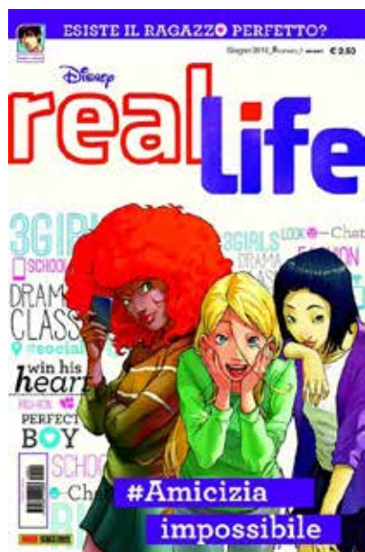
Figura 14 - Real Life es un producto italiano pero controlado por Disney Publishing, la compañía que más controla los mensajes dirigidos a las jovencitas en el siglo XXI (la historietta fue creada por Alessandro Ferrari, Alberto Zanon, Elena Pianta y Andre Scoppetta).

revistas dirigidas a preadolescentes que se publican actualmente en España y también en otros países, como Violeta , Top Model o Real Life (Figura 14), encontramos los mismos cuatro valores que en las revistas infantiles pero con una gran incidencia en el valor “amor”, que se