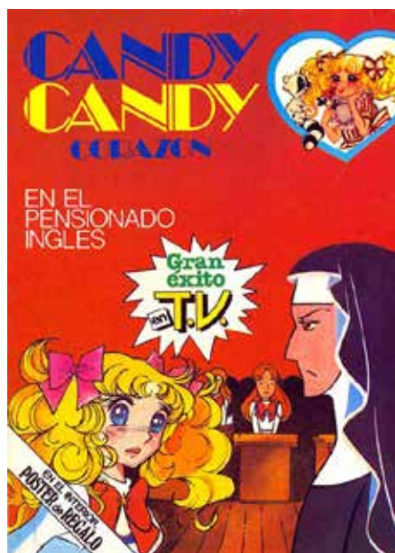
Figura 12 - Los manga para chicas trajeron desde Japón nuevos modelos para las niñas europeas: jovencitas determinadas, luchadoras, con carisma y con carácter al mismo tiempo. Candy Candy fue una creación de las japonesas Keiko Nagita y Yumiko Fijii.