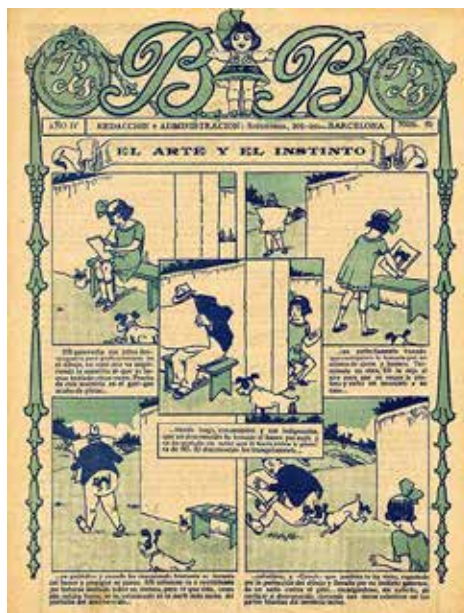
Figura 3 - BB, revista del editor Buigas, el mismo que creó el título TBO, fue el primer cómic exclusivamente para niñas editado en España en el año 1920. Dibujo de Urda.

El tebeo Mis Chicas permaneció en los quioscos toda la década, hasta 1950, sin embargo su ejemplo no cundió, y los tebeos que triunfaron a partir de la