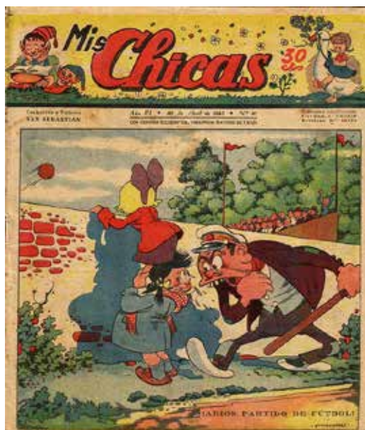
Figura 5 - Mis Chicas, revista nacida en 1943 bajo la dirección de Consuelo Gil, fue el referente de los tebeos para niñas durante los años cuarenta. Portada de Arturo Moreno.