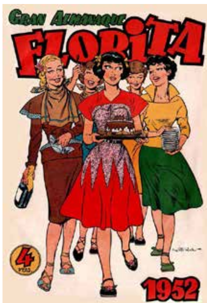
Figura 7 - El gran dibujante Vicente Roso retrató perfectamente a la muchacha ideal de los años cincuenta en España: hacendosa y hogareña, pero deportista y siempre a la moda, como lo era Florita.

editores no obedecían órdenes emanadas de instancias superiores. Ahora bien, el modo simplificado de concebir la presencia de la mujer como ente humano y social terminó fraguando en un modelo esencialista: joven bondadosa y de conducta intachable, hermosa pero sencilla, recatada y obediente, soñadora con una figura heroica (príncipe con dote, joven honrado con trabajo), cuya aspiración máxima era estar pendiente de su casa y fiel a su marido, puesto que la meta final en su vida era el matrimonio. Y, con todo, ese ideal resultó absolutamente