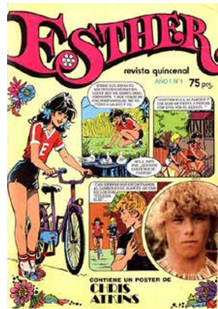
Figura 10 - Las historietas de jovencitas traducidas desde publicaciones británicas, como Patty's World ( Esther en España) conquistaron el corazón de las jóvenes lectoras de los años setenta.

infantiles en el comienzo de los sesenta. La utilizó IMDE en 1963 en el tebeo infantil Aquí Marilyn , de corta vida y que se inspiró en personajes populares por entonces en la televisión: Marisol, cuyas canciones reproducía y adaptaba en historieta en sus páginas, y las marionetas de Herta Frankel. Otra idea interesante de IMDE vinculada con lo femenino fue la Colección Heroínas , una suerte de línea editorial que agrupó cuadernos para chicas con toques de romance pero con la tensión aventurera flotando sobre todos los argumentos, ya que las protagonistas eran jóvenes que trabajaban al mismo tiempo que se desenvolvía en situaciones de intriga o acción: Lilian , Azafata del Aire y la más popular Mary "Noticias", que llevó dibujos de Carmen Barbará. En aras de la verdad hay que aclarar que ellas corrieron sus aventuras siempre cerca de sus novios o amigos, que les dieron el pertinente apoyo masculino y con quienes terminaron casándose, como era previsible.