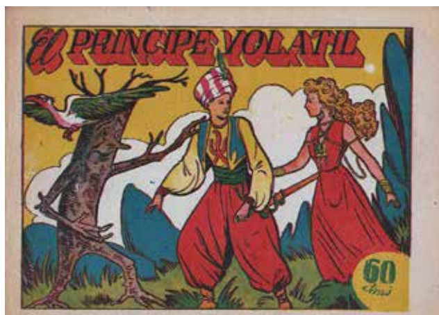
Figura 4 - Tras la Guerra Civil se creó un mercado floreciente de cuadernos de historietas que adaptaban narraciones tradicionales y cuentos moralizantes, como este de Editorial Marco.