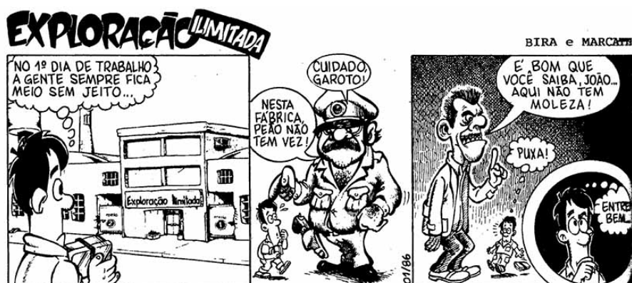
Figura 4

de Exploração Ilimitada foi publicada no dia 25 de fevereiro de 1986, na edição nº 600 (figura 4). Tratava-se de registrar o primeiro dia de trabalho do operário João.