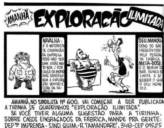
Figura 3 - Boletim Sindiluta , nº 599 - 24 de fevereiro de 1986, p.2