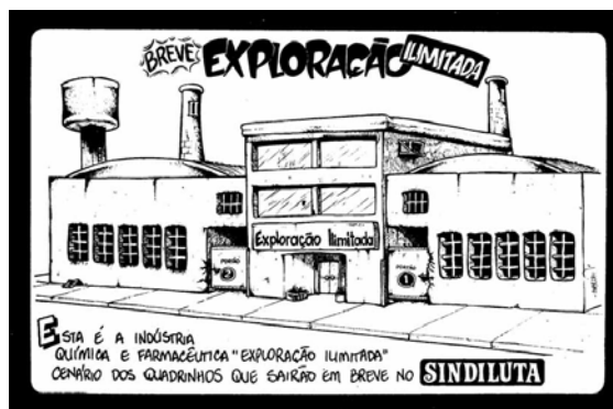
Figura 2 - Fonte: Boletim Sindiluta , nº 594 - 06 de fevereiro de 1986, p.2