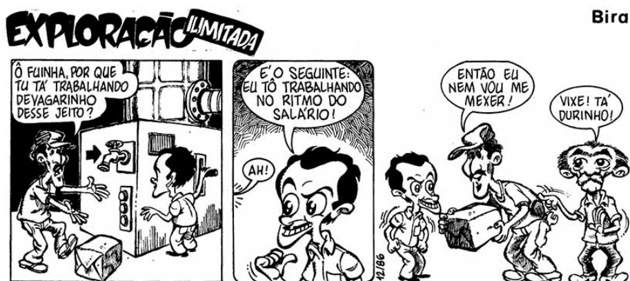
Figura 8 - Fonte: Boletim Sindiluta , nº 630 - 15 de abril de 1986, p.2

Como o espaço para este artigo é limitado, selecionamos apenas mais uma tira para análise. Ela foi publicada no dia 17 de abril na edição nº 631 (figura 8).