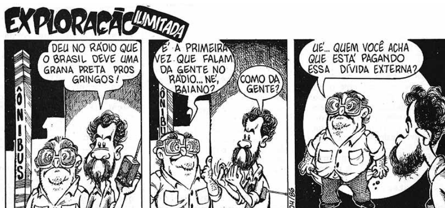
Figura 7 - Fonte: Boletim Sindiluta , nº 610 - 13 de março de 1986, p.2

Outro tema muito debatido no contexto do movimento sindical à época era a questão da dívida externa. O lema “Não ao pagamento da dívida externa” era uma das principais bandeiras políticas da Central Única dos Trabalhadores (CUT) e dos sindicatos ligados ao “novo sindicalismo”. Com isso, o assunto também foi parar numa das conversas entre personagens da Exploração Ilimitada , na edição nº 610 de 13 de março de 1986 (figura 7).