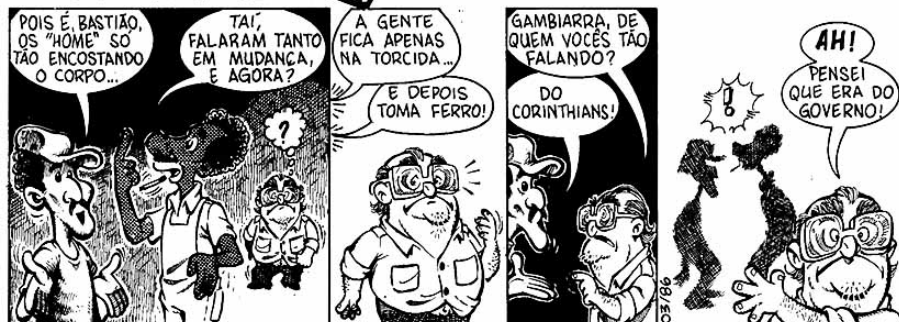
Figura 6 - Fonte: Boletim Sindiluta, nº 608 - 11 de março de 1986, p.2

A tira foi construída em quatro quadros. No primeiro quadrinho, aparecem