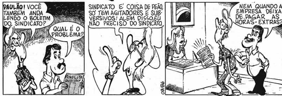
Figura 5 - Fonte: Boletim Sindiluta, nº 622 - 03 de abril de 1986, p.2

“Qual o problema?”. Isso já revela algumas características de cada um dos personagens. Enquanto Pedro Henrique , numa postura bastante arrogante, manifesta sua recusa à prática da leitura dos jornais e boletins do sindicato, Paulão expressa absoluta tranquilidade em relação a essa prática (lembrando que a circulação do boletim Sindiluta era diária).