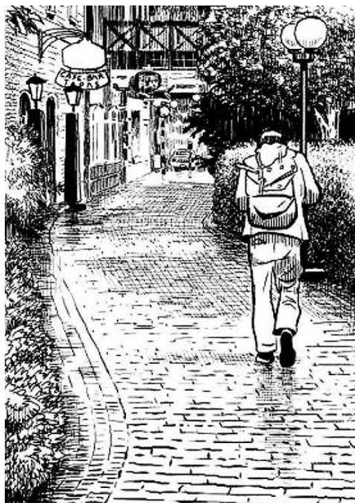
Figura 3 - Fonte: McCloud, Desenhando quadrinhos , 2008, p. 159

A criação de histórias em quadrinhos demanda a construção de mundos que proporcionam senso de localidade para seus leitores. Para criar esse mundo, McCloud (2008, p. 158-159) enfatiza que “representar todas as vistas e sensações de ângulos pode ser um desafio intimidador. Mas com conhecimento... esforço... e a disposição de ir além do meramente ‘adequado’... Seus mundos podem parecer tão impressionantes e vividos como quaisquer outros mundos. Reais ou imaginários”. Esse mundo, sendo um universo complexo, será habitado por personagens também complexos e, então, experimentado por seus ângulos de visão e profundidade.