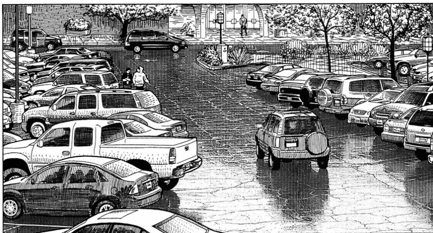
Figura 4 - Fonte: McCloud, Desenhando quadrinhos , 2008, p. 165

2008, p. 167). Um ambiente “realista” fornece um ambiente complexo e com grande senso de profundidade, onde o leitor tem a impressão de estar no lugar por meio de uma visão panorâmica, seja a representação de um lugar que realmente existe, seja a criação de outro lugar através da verossimilhança com o que é real. Veja-se, por exemplo, a Figura 4: