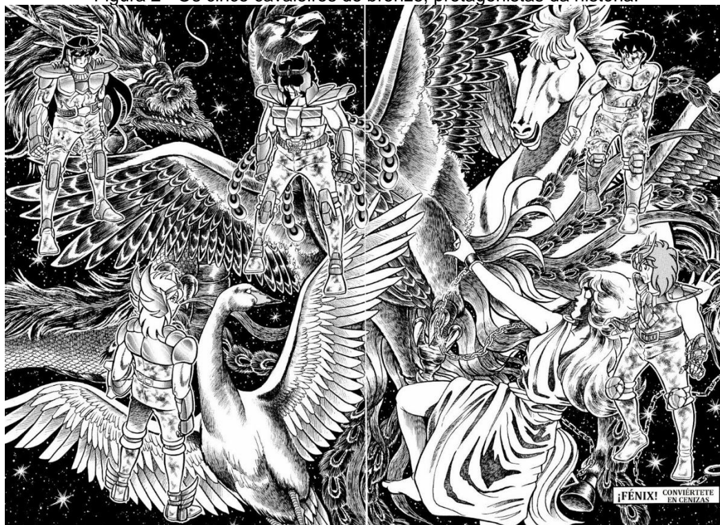
Figura 2 - Os cinco cavaleiros de bronze, protagonistas da história.