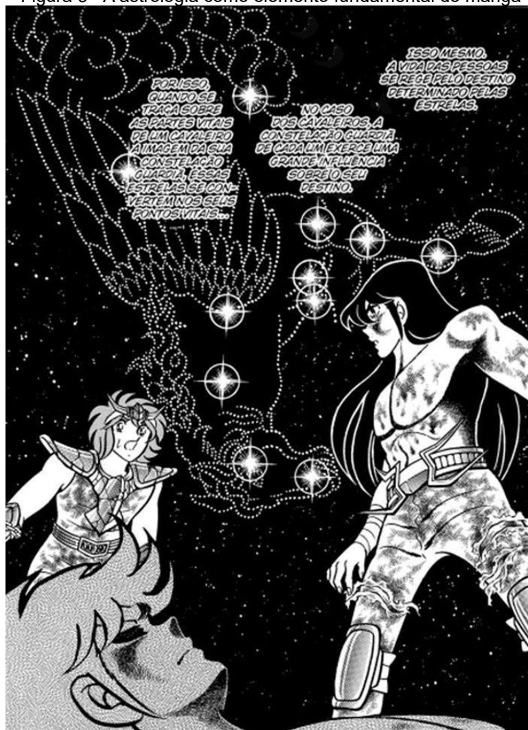
Figura 3 - A astrologia como elemento fundamental do mangá

No mangá em questão, o cosmo está intrinsecamente ligado às constelações, as quais, no âmbito dessa energia, remetem mais à astrologia do que à astronomia. Conforme delineado no mangá, o destino de um cavaleiro ou amazona – e dos seres humanos em geral – é ditado pelas estrelas de sua constelação protetora. No entanto, essas constelações protetoras não se limitam aos signos do zodíaco tradicionalmente associados à astrologia. Por exemplo, os protagonistas da série – Seiya, Shiryu, Shun, Hyoga e Ikki – encontram-se sob a proteção não apenas das estrelas de seus signos zodiacais, mas principalmente das constelações representadas em suas armaduras: Pégaso, Dragão, Andrômeda, Cisne e Fênix, respectivamente. Dessa forma, a atmosfera mística e espiritual não é restrita às constelações zodiacais, uma vez que todas são envoltas por essas características (figura 3).