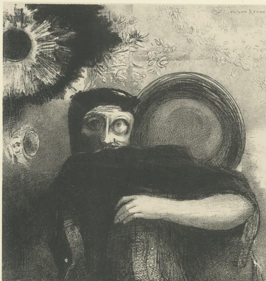
Un étrange JONGLEUR.