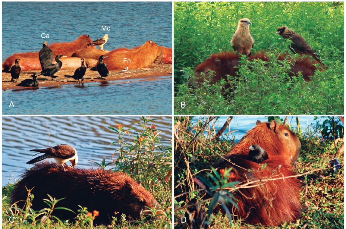
FIGURA 3: Associações notáveis entre aves e capivaras. (A) presença simultânea de três espécies de aves que usam os recursos fornecidos por um pequeno grupo de capivaras: Coragyps atratus (Ca) à esquerda, diante de uma capivara deitada; Milvago chimachima (Mc) pousado no flanco de uma jovem, ambas as aves à procura de carrapatos; Fluvicola nengeta (Fn) à espera de moscas atraídas pelo grupo. As demais cinco aves são biguás Nannopteris brasilianus descansando; (B) à procura de carrapatos em capivaras, um grupo familiar de M. chimachima composto por um juvenil à esquerda e outro, mais jovem, à direita na mesma capivara e um adulto (não visível na foto) em uma capivara próxima; (C) após apanhar um peixe morto na margem da lagoa, M. chimachima usa uma capivara deitada como poleiro de alimentação; (D) deitado no dorso de uma capivara que descansa, Crotophaga ani toma sol, usando o mamífero como poleiro.

As relações das aves com as capivaras variaram de acordo com a espécie da ave e a categoria de uso. Por exemplo, quando Machetornis rixosa usava a capivara como poleiro de caça (Fig. 2A), ficava atento aos insetos próximos, voava para apanhá-los e voltava ao poleiro. A capivara continuava pastando ou descansando durante esta atividade da ave. Por outro lado, quando uma ave inspecionava o corpo da capivara à