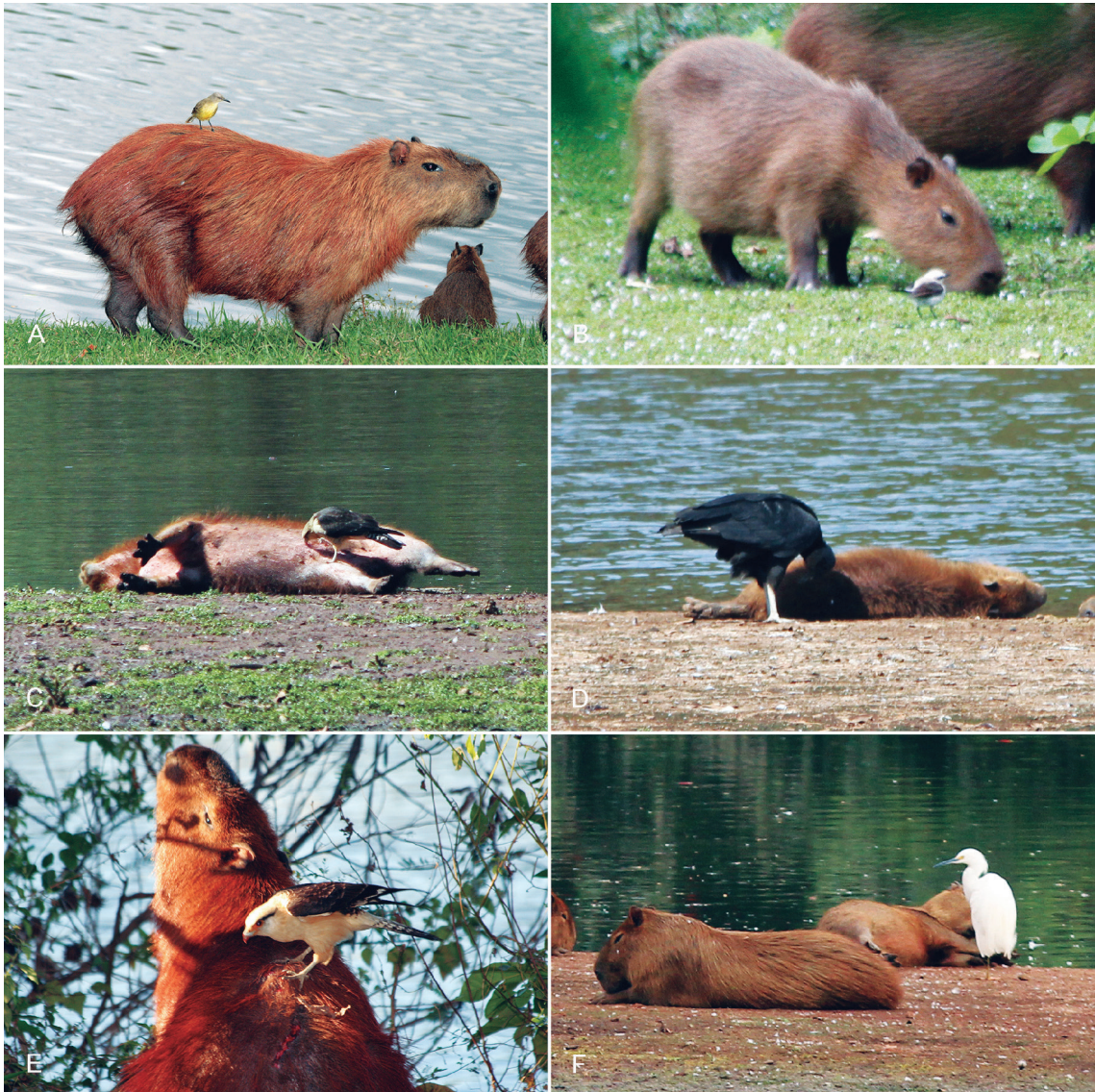
FIGURA 2: Exemplos de aves associadas a capivara ( Hydrochoerus hydrochaeris ). (A) uma das categorias de uso da capivara é a de poleiro de caça por Machetornis rixosa , uma relação de comensalismo; (B) ao pastar, uma capivara age como batedora para Fluvicola nengeta , que apanha insetos perturbados pelo mamífero, exemplo pouco frequente de comensalismo por esta ave; (C) posando deitada, uma capivara expõe as partes inferiores do corpo a Milvago chimachima que procura carrapatos, uma relação de mutualismo; (D) uma jovem capivara expõe o dorso, fonte de partículas orgânicas catadas por Coragyps atratus , uma relação de comensalismo; (E) agarrado à protuberância causada por berne, Milvago chimachima toma sangue e retira pequenas porções de tecido doente de uma capivara (que joga a cabeça para trás sinalizando incômodo), uma relação de semiparasitismo; (F) uma jovem capivara deita para posar em presença de Egretta thula , que apanha moscas atraídas pelo mamífero, num exemplo pouco frequente de comensalismo.

Obtivemos 111 encontros de capivaras, dos quais em 56 (50,4%) houve aves associadas. Na gran-