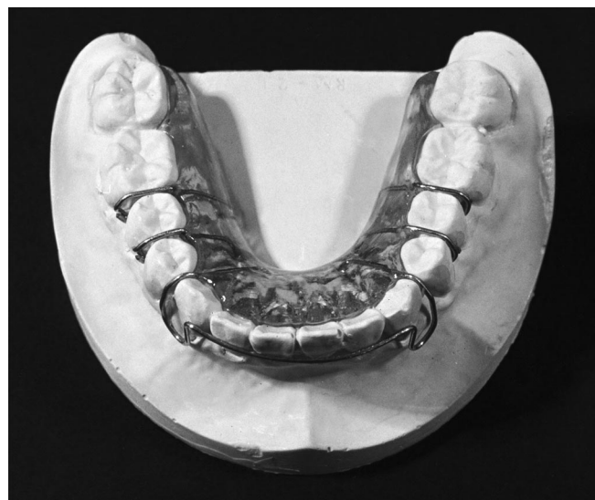
FIGURA 1 - Modelo do aparelho usado.

vação com dentífrico não fluoretado formulado pela Kolynos do Brasil S. A. (KB-1080-1-29);