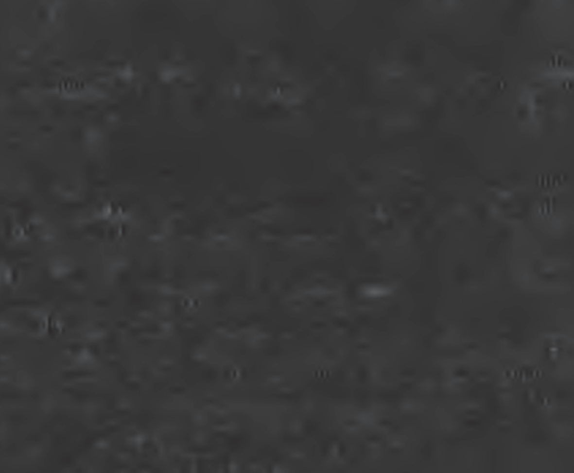
Figure 1. Relationship between the number of fish and the number of prey items.

where N is the number of fish, P is the number of prey items, and K is the carrying capacity.