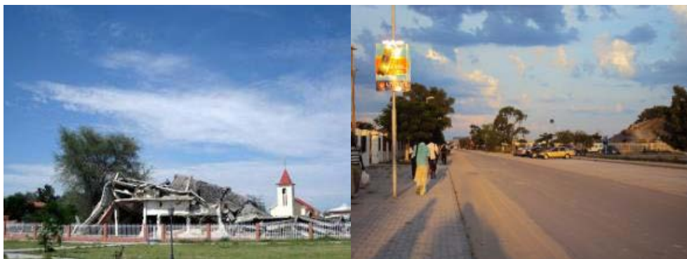
Figura 2 Monumento em Ondjiva localizado na praça central da cidade, em frente a um templo católico.

A presença da guerra na vida dos habitantes do Cunene aparecia concretamente na praça central de Ondjiva, capital da província, em frente a uma Igreja Católica. Escombros cercados por uma mureta recém-construída e uma placa explicativa formavam um conjunto classificado pelo poder público como monumento (Figura 2). Tratavam-se de destroços da sede do governo provincial, construída em 1969, ainda no período colonial, e destruída em 1981 pelas forças armadas sul-africanas com provável aceite da UNITA. Os escombros foram transformados nesse inusitado monumento em 1998, seis anos depois da retomada da cidade pelo governo angolano e no mesmo ano em que estavam agendadas eleições antes da retomada do conflito. A placa apresenta dizeres sobre a “importância da manutenção da memória do povo angolano sobre os duros tempos de guerra”. Mas haveria como esquecer?