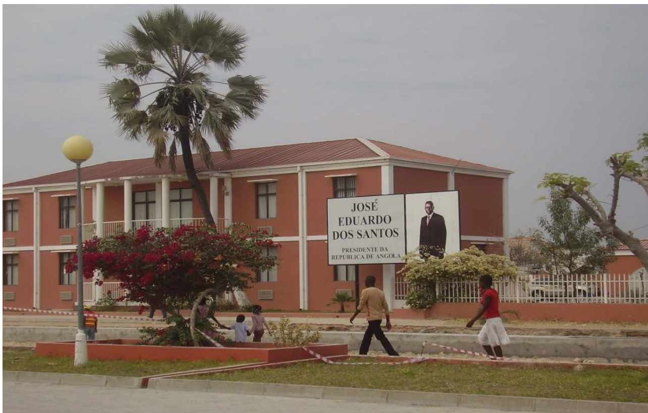
Figura 1 Sede do Governo Provincial do Cunene.

Em 2010, as zonas urbanas da província do Cunene representavam o retrato da “reconstrução nacional”. Na capital, Ondjiva, havia obras visíveis em edifícios e nas ruas; em Santa Clara, posto fronteiriço com a Namíbia, a construção em andamento do que seria um porto seco estratégico na rota comercial Angola-Namíbia-África do Sul. Na sede do governo provincial, um grande retrato legendado do presidente angolano em outdoor indicava a unidade nacional pela presença personificada do Estado (Figura 1).