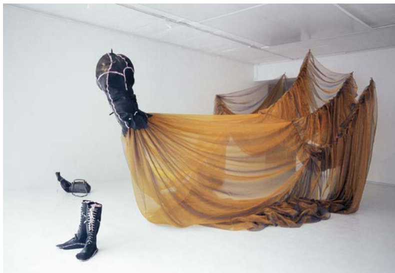
Figura 1 Nicholas Hlobo, Unongayindoda (2006), instalação incluindo Imtyibilizi Xa Yomile e In a While : organza, borracha, fita. 260 x 600 x 330cm (variável). Disponível em: www.stevenson.info (acesso em 20/9/2016).

O uso peculiar que Hlobo faz da palavra unongayindoda retraduz as maneiras pelas quais o termo foi usado por estudiosas de gênero e questões LGBT. Uma pesquisadora proeminente argumenta que “ Nongayindoda ” em isiZulu , “estigmatiza mulheres entendidas como vivendo além das normas heterossexuais aceitas de vestimenta, comportamento ou desejo. Por outro lado, não há termos amplamente aceitos, positivos e não-coloniais para se referir uma identidade sexual não convencional que seja celebrada e escolhida” (Bennett, 2010: 37). Do mesmo modo, o Relatório Human Rights Watch (2011: 20) associa esse termo