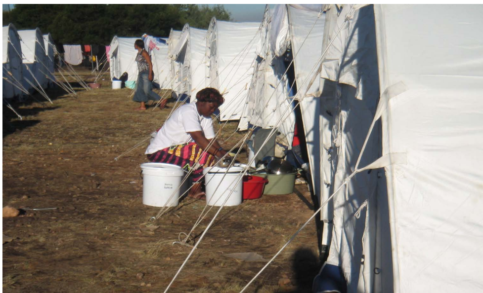
Figura 1 Um campo de pessoas refugiadas em Johannesburgo devido à violência xenofóbica, junho de 2008.

Estas eleições aconteciam num país que tinha conquistado a sua independência em 1980 depois de 15 anos de luta armada contra um regime de uma minoria branca que tinha unilateralmente decidido a independência da antiga Rodésia (atualmente Zimbábue) da Inglaterra em 1965. O presidente Mugabe lidera o país desde 1980. Foi primeiro ministro e desde 1986 é presidente. Apesar da existência de um programa de reforma agrária desde a década de 1980, a população branca, que representava cerca de 0,6% da população, detinha 70% da terra agrícola mais fértil do país e, em 2000, o governo prosseguiu com o seu programa de confiscação e redistribuição de terra. Esta decisão, junto com uma série de períodos de seca, com a degradação dos apoios financeiros externos, levaram a queda da produção agrícola. O Presidente Mugabe enfrentou uma ampla gama de sanções internacionais. Em 2002, o Zimbábue foi suspenso da Commonwealth.