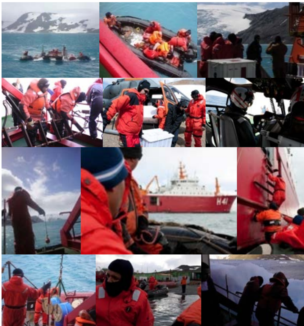
Figura 1 Espaços antárticos em atividade.

uma escala pré-estabelecida. Um marinheiro, pertencente ao grupo da avaria (ou seja, grupo de plantão, acionado quando algum equipamento apresenta problemas), relata a preeminência dos horários prestabelecidos da alimentação coletiva (café-da-manhã, almoço e jantar) e do serviço: “Cumprir horário é só o de serviço e da hora do rancho, que temos que levantar para comer. Só isso”, diz o marinheiro.