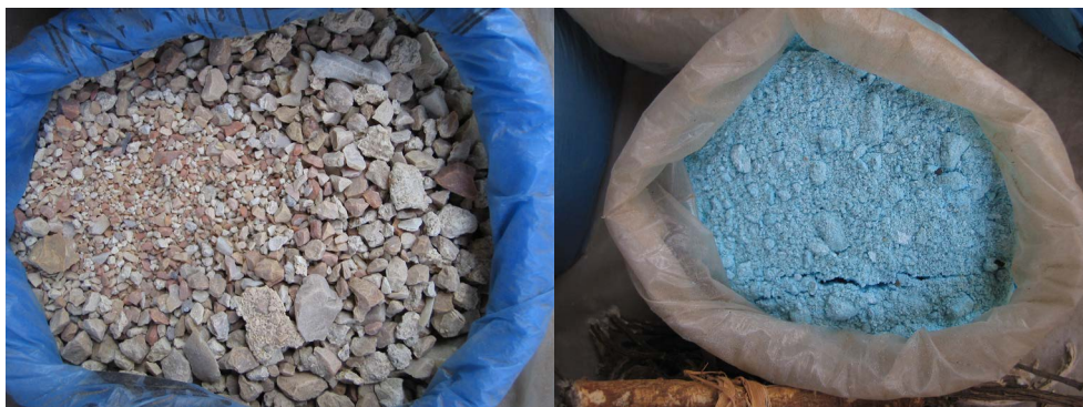
Figura 3 Produtos de inserção e aplicação vaginal. Mercado Kwachena, Tete 2005.

o parceiro comprometido. Os dados quantitativos do “estudo sobre práticas vaginais” indicam que 72% das mulheres mencionaram que o alongamento dos lábios vaginais é símbolo de identidade feminina, 38% assinalaram que esta prática é um meio usado para manter o parceiro atraído sexualmente e 35% informaram que aumenta o prazer sexual masculino (François et al., 2012: 211). É interessante notar que a adoção de procedimentos vaginais para tentar manter um parceiro não é surpreendente, pelo menos na província de Tete, já que quase um terço das mulheres que participaram neste estudo vivia em uma relação estável ou casadas e afirmou que seu parceiro estava envolvido sexualmente com outra mulher (François et al., 2012).