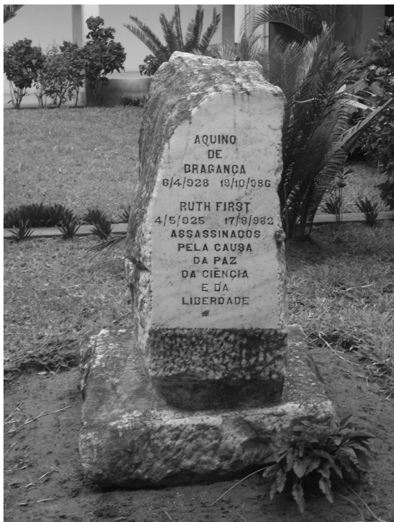
Figura 2 Lápide em memória a Aquino de Bragança e Ruth First no jardim do Centro de Estudos Africanos, Universidade Eduardo Mondlane, Maputo.

O Centro realizou muitas pesquisas de escala pequena sobre temas tais como o desemprego. Mas é de salientar que a presença dos alunos nos permitiu realizar projetos muito maiores e mais ambiciosos. Um deles foi a investigação sobre algodão, realizado em colaboração com um instituto norueguês. O estudo integrou aspetos agrícolas com aspetos industriais. Duas ondas de investigação rural foram conduzidas em Nampula e Zambézia, dois estudos de fábricas nas empresas Texmoque e Texlom, além de análises sistemáticas de fontes documentais e estatísticas. Uma série de relatórios foi publicada em 1979, 1980 e 1981, com a última contribuição da Noruega aparecendo em 1982. Um desses relatórios provocou uma reação negativa nas fileiras superiores do partido, porque descreveu o uso de trabalho infantil nas plantações de algodão. Alguns exemplares com uma fotografia das crianças esperando pagamento foram retirados de circulação. Ruth, evidentemente, nunca hesitou em escrever o que ela viu, e sua prática crítica em Moçambique em apoio à revolução não era diferente