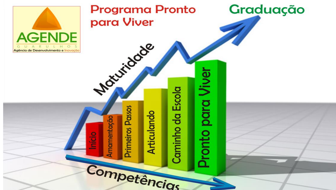
Figura 1: Modelo do Programa PPV.