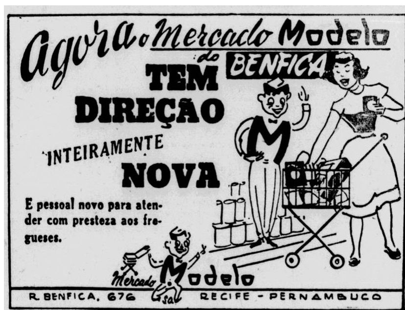
Figura 1 A propaganda do Mercado Modelo trazia os elementos principais daquela nova forma de fazer compras: o carrinho e as prateleiras, quase sempre repletas de enlatados.