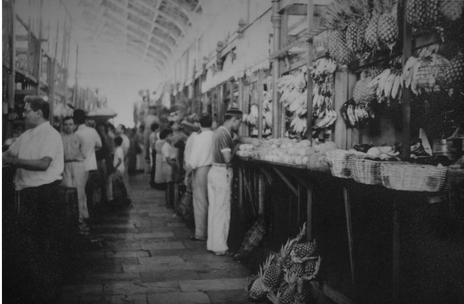
Figura 3 Aspecto interno do Mercado de São José em meados do século XX, com bancas mostrando suas frutas aos potenciais fregueses, principalmente bananas e abacaxis.