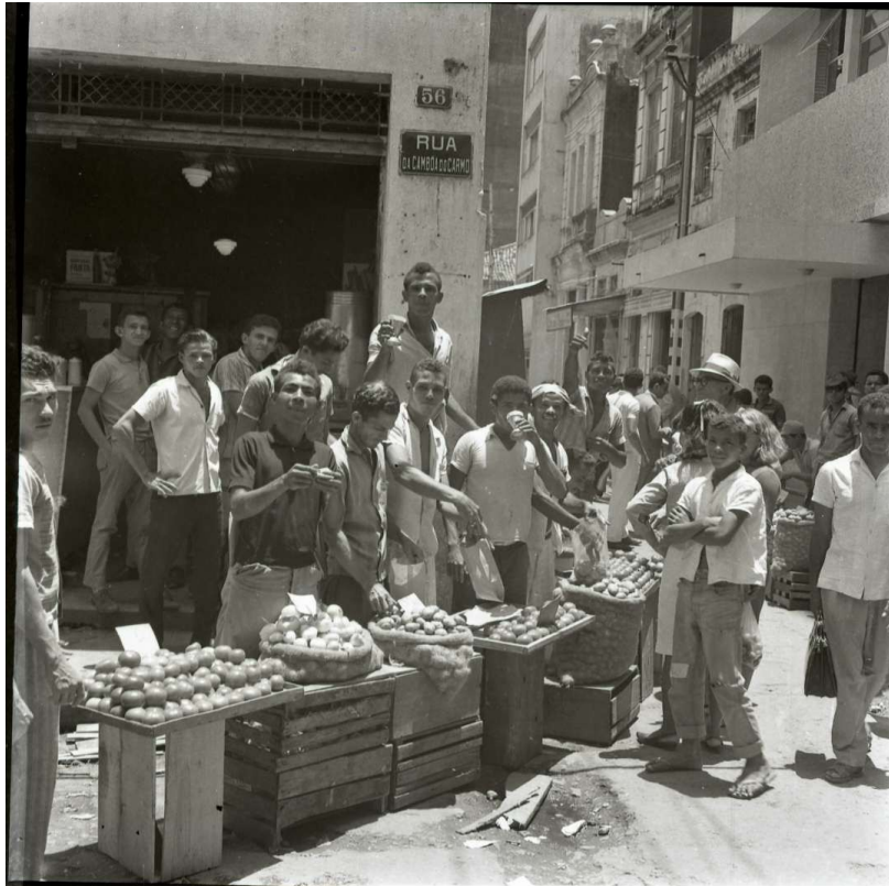
Figura 6 Os verdureiros expõem seus produtos em feira do centro de Recife em meados do século XX. A imagem mostra as precárias condições do local, com hortaliças equilibradas em caixotes, expostas às intempéries e em meio ao lixo.