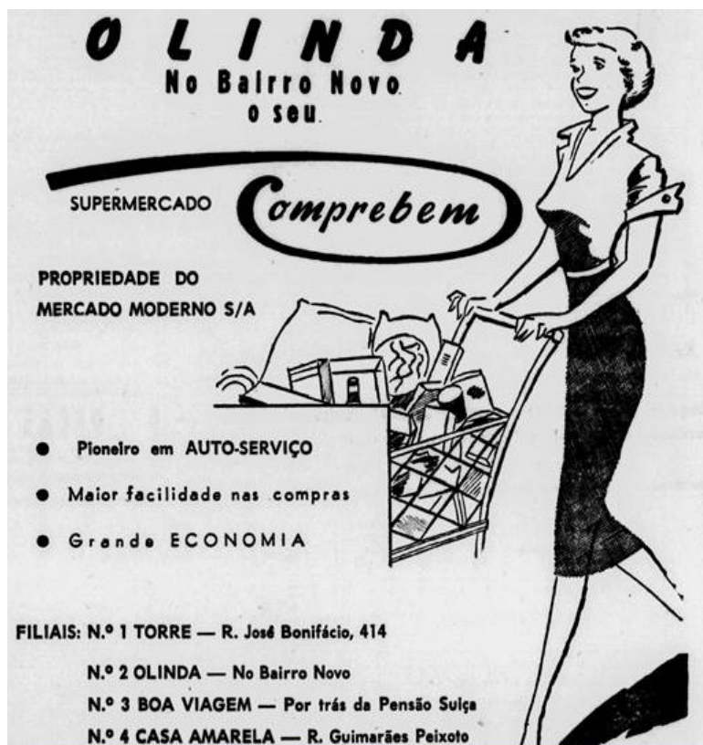
Figura 2 Apesar de o concorrente Mercado Modelo ter surgido antes, a rede Comprebem se anunciava como a primeira a implantar o sistema de autosserviço em suas unidades, que pareciam se multiplicar sem parar, chegando à cidade de Olinda. Imagens como esta eram, além de chamativas, didáticas, pois ensinavam ao público, sobretudo às mulheres, como se mover e se portar no novo espaço.

Fonte Diário de Pernambuco , Recife, 6 out. 1957.