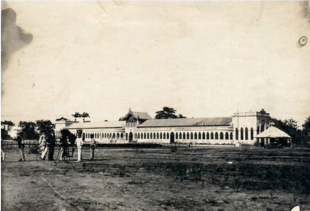
Figura 5 O mercado modelo de Delmiro Gouveia era grandioso, com arcos que se agigantavam sobre os admirados transeuntes. Com 18 portões, 112 janelas e venezianas e 264 boxes com balcões de mármore onde se vendiam de roupas a alimentos. Tudo nele era superlativo. Destruído pelo fogo, de suas ruínas surgiria o prédio do comando-geral da Polícia Militar de Pernambuco, o Quartel do Derby, até hoje ponto de referência para os recifenses.