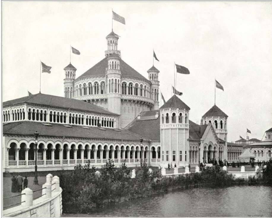
Figura 4 A suntuosidade do Fisheries Building inspiraria o desenho do mercado de Delmiro, construído seis anos depois da Exposição Universal de Chicago. Ainda que menor que sua contraparte norte-americana, o prédio erguido no Recife compartilharia da horizontalidade, das janelas em arcadas e da posição junto à água, no caso do Recife, o rio Capibaribe.

Fonte Autor Desconhecido. The Columbian Gallery: A Portfolio of Photographs from the World's Fair . Chicago: The Jones Bros. Pub. Co., 1893.