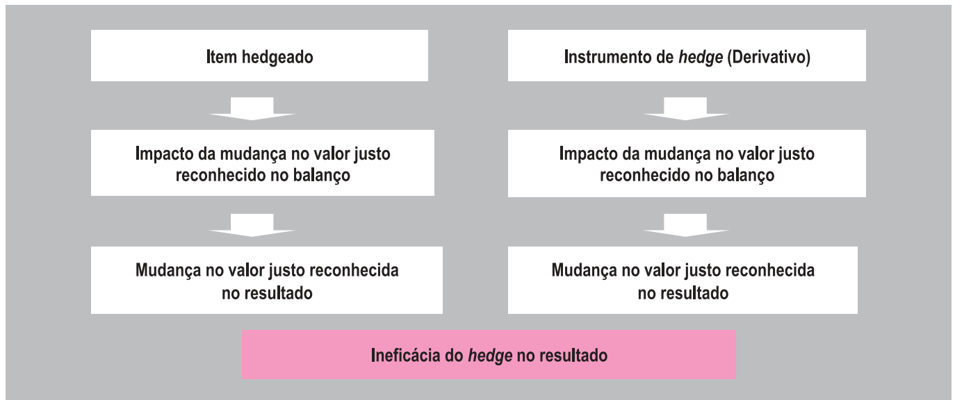
Figura 1: Esquema de Contabilização do Hedge de Valor Justo

Na figura 2, o esquema mostra que a parcela efetiva do