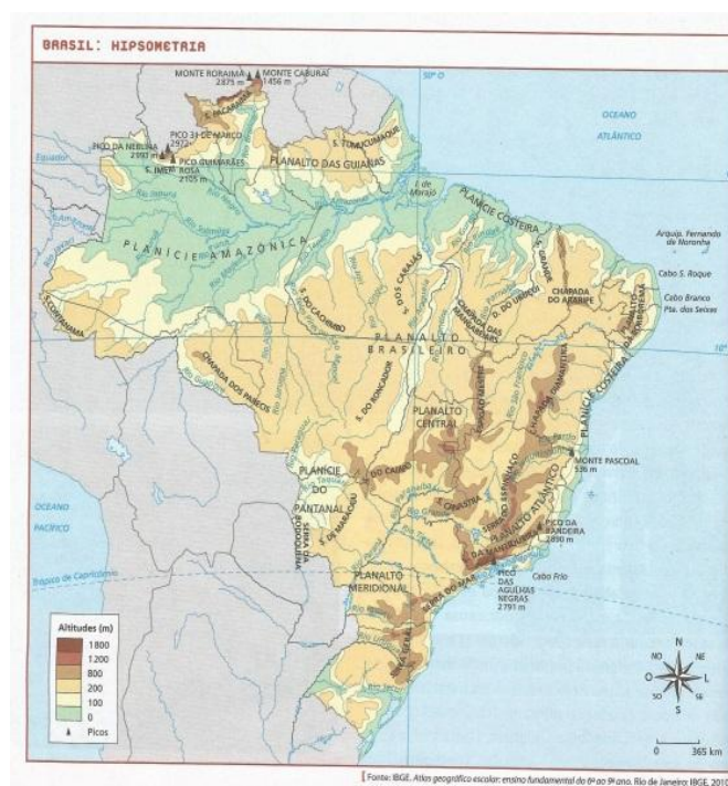
Figura 4: Cartografia do livro “Geografia: sociedade e cotidiano”.

O relevo é o primeiro item descrito pelos autores. Esses explicam como as cores representam as altitudes no mapa (Figura 4), além de salientar onde se encontram os mais altos pontos do país.