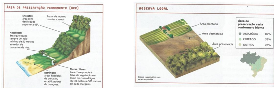
Figura 5: Ilustrações do livro “Geografia: sociedade e cotidiano” Fonte: MARTINS; BIGOTO; VITIELLO (2012).

As ilustrações a respeito da temática explicam e pontuam onde ocorrem essas áreas de preservação (Figura 5).