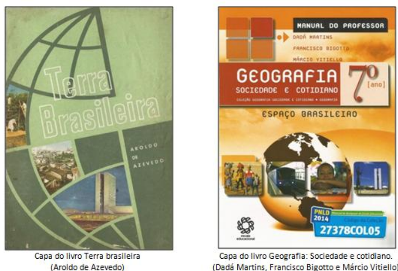
Figura 1: Capas dos livros didáticos analisados nesta pesquisa.

A partir da análise dos livros selecionados, foi possível traçar uma linha-padrão de apresentação e abordagem da geografia e, mais precisamente, do tema geografia física do Brasil, onde buscou-se identificar as diferenças de discurso na apresentação dos temas.