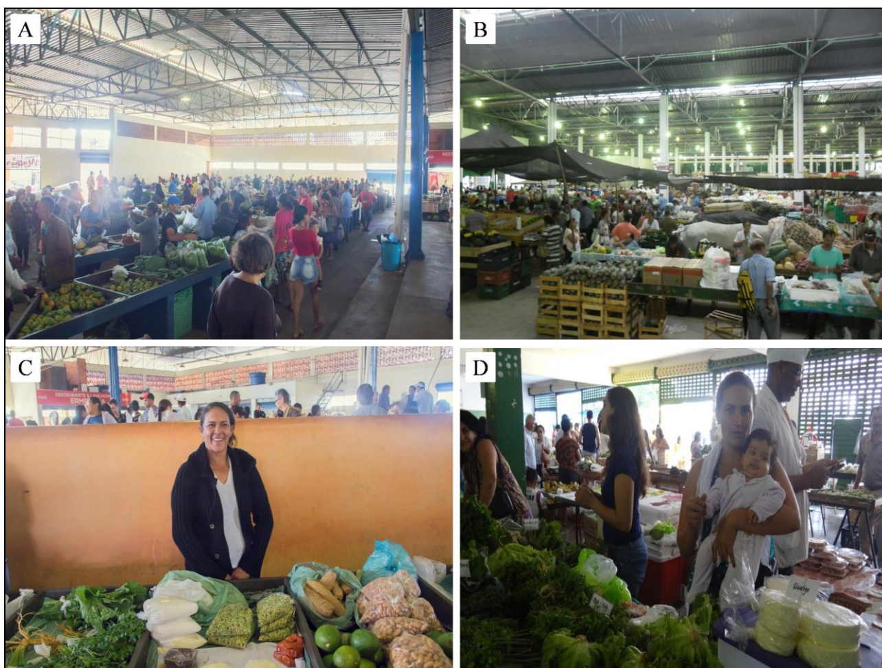
Figura 1: Visualização dos mercados rurais e feiras agrícolas dos municípios em estudo: [A] mercado rural de Bocaiúva (MG); [B] mercado rural de Montes Claros (MG); [C] feirante do mercado de Bocaiúva (MG) e; [D] feirante do mercado de Montes Claros(MG).

As feiras, conforme relatos possuem grande valor financeiro para essas produtoras rurais, já que para algumas é a principal forma de sustento de seu núcleo familiar. No entanto, esses ambientes vão além do comércio, tornando-se pontos de socialização, troca de informações e conhecimentos. Além disso, a feira nos mercados municipais permite que as produtoras façam trocas de produtos entre si, contribuindo, dessa forma, com a reposição dos objetos que precisam em casa.