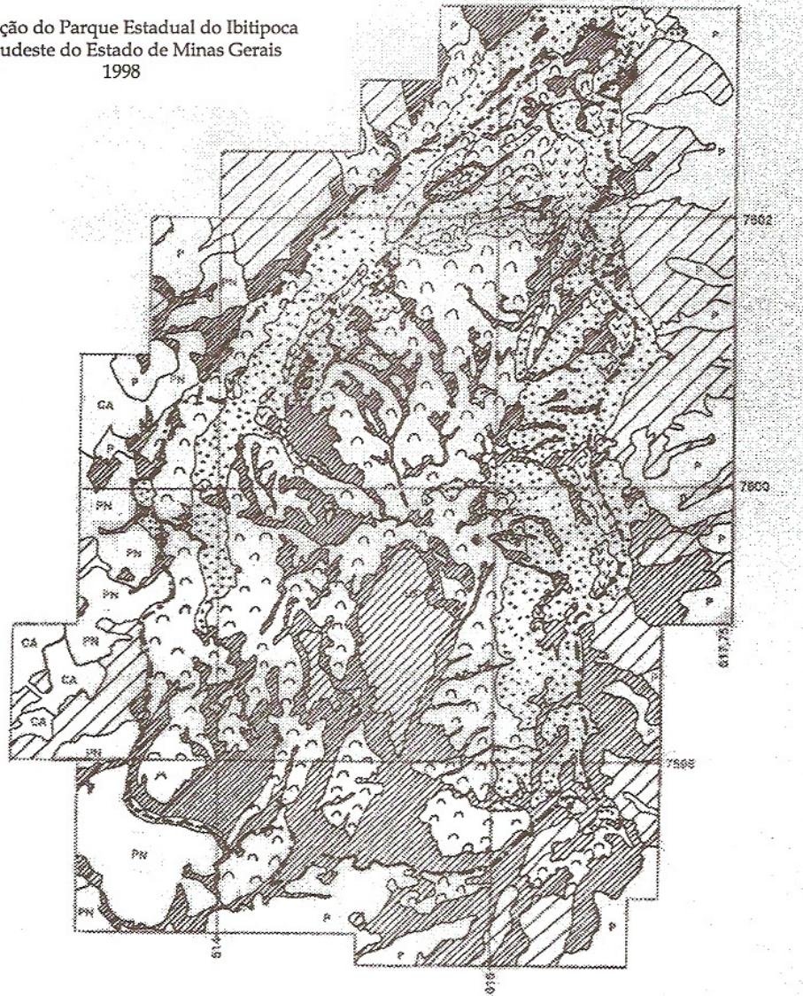
Figura 2 Vegetação do Parque Estadual do Ibitipoca sudeste do Estado de Minas Gerais 1998