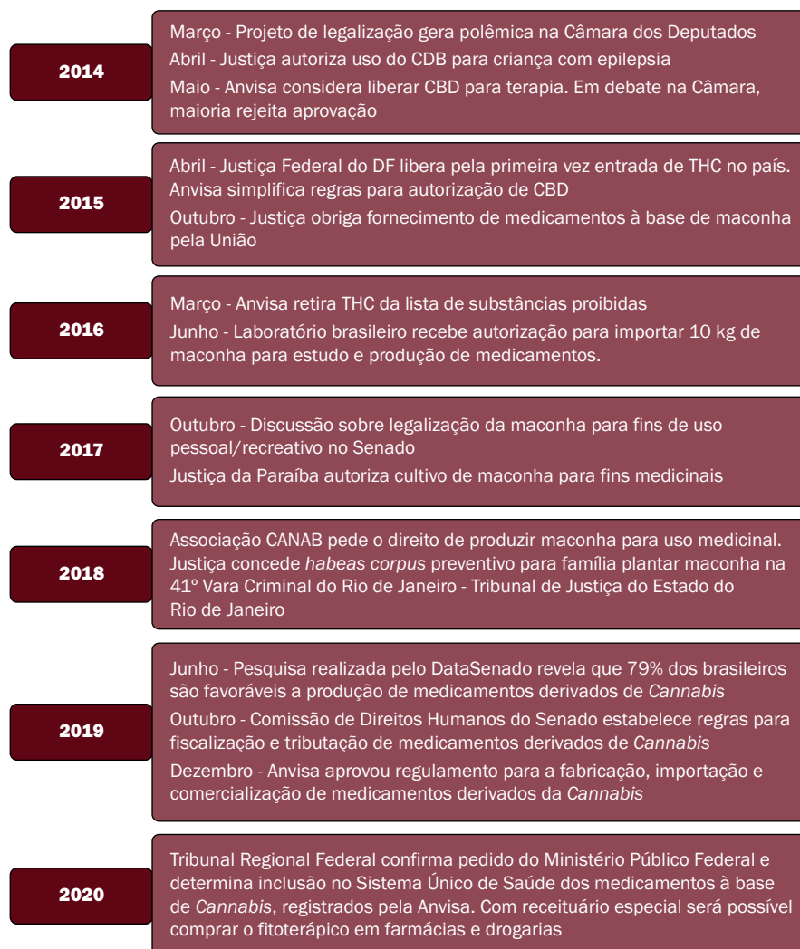
FIGURA 1. Principais decisões tomadas no âmbito dos poderes Executivo, Legislativo e Judiciário entre 2014 e 2020 sobre os medicamentos derivados de Cannabis Fonte: Agência Senado (2014-2019).

A Figura 1 destaca algumas das principais decisões tomadas entre 2014 e 2020 no âmbito dos três poderes sobre o tema em questão. As mesmas notícias foram veiculadas em diferentes mídias, mas este estudo optou por trabalhar com a Agência Senado como fonte principal. A linha do tempo descreve algumas das principais decisões tomadas pelos poderes nos últimos seis anos no Brasil (2014 a 2019) e revela um pouco desses comportamentos em relação aos medicamentos derivados da Cannabis . A partir da análise dessa linha, é possível observar estabilidade e mudança na construção das políticas públicas acerca do tema, além de indicar evolução, consistência e involução dos entes federados, uma vez que a questão se inseriu definitivamente na agenda pública na última década, a despeito de esforços anteriores para barrar o tema.