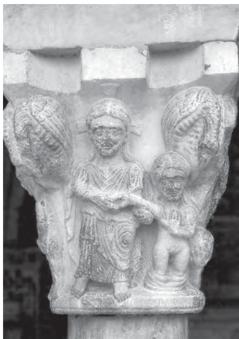
Figura 1 - Elme

tas e observado por milhões de pessoas, não era uma figura imutável, fixada pelos textos e pela tradição. Era a presentificação de um protótipo. Em Adão estavam contidos e prefigurados toda grandeza e toda fraqueza, todas virtudes e todos os vícios. Na sua trajetória da glória à perdição e novamente à glória, Adão sintetizava a história humana. Naquele momento em que renascia a autobiografia como gênero literário, a representação plástica de Adão e Eva, ao alcance de letrados e analfabetos, de homens e mulheres, de jovens e velhos, funcionava como uma autobiografia visual e coletiva do cristão medieval.