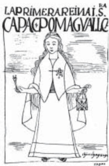
Chinchaysuyu – Primeira Colla