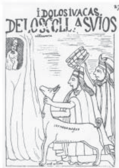
Collasuyu – Huaca