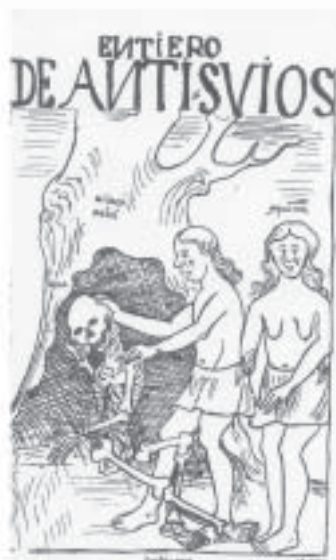
Antisuyu – Enterramientos