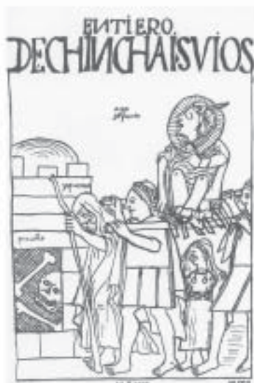
Chinchaysuyu – Enterramientos