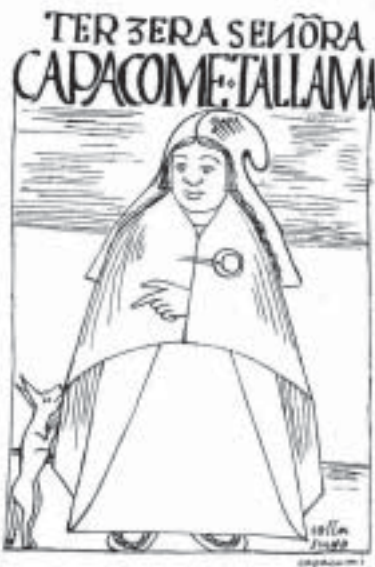
Collasuyu – Terceira Colla