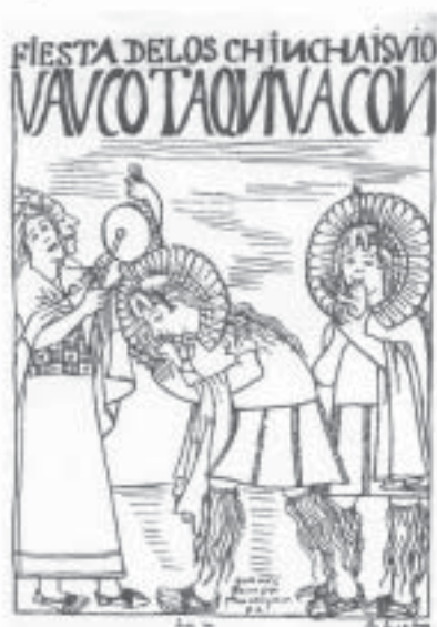
Chinchaysuyu - Festas