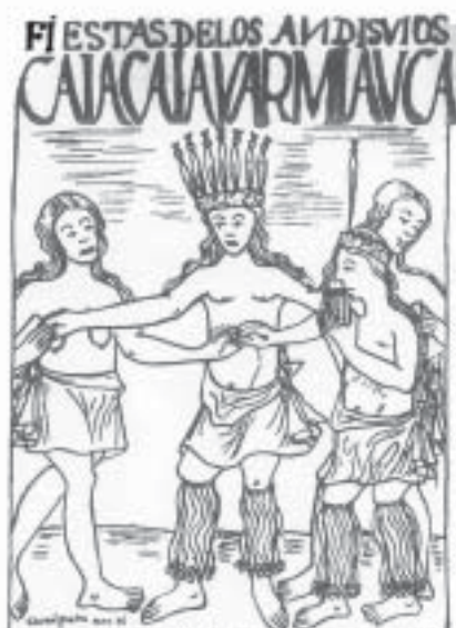
Antisuyu - Festas