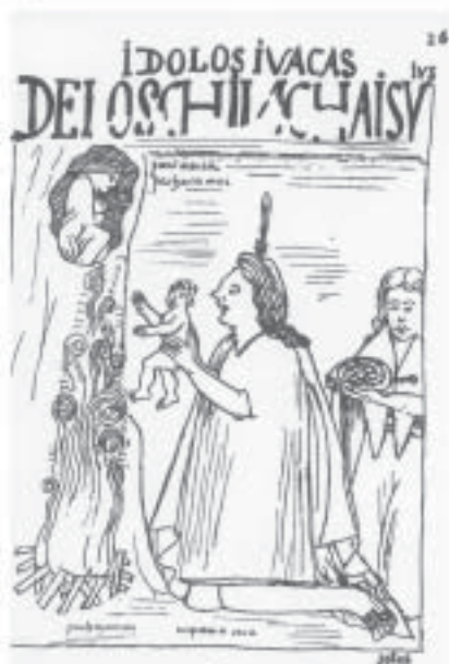
Chinchaysuyu – Huaca