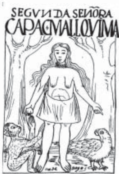
Antisuyu – Segunda Colla