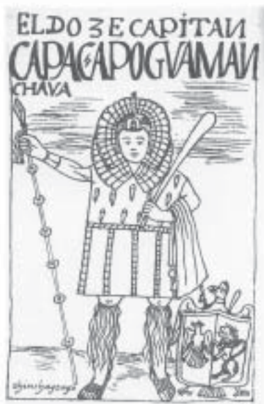
Chinchaysuyu – Décimo Segundo Capac