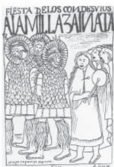
Condesuyu - Festas