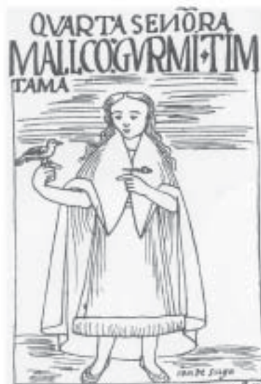
Condesuyu – Quarta Colla