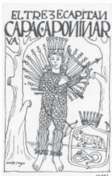
Antisuyu – Décimo Terceiro Capac