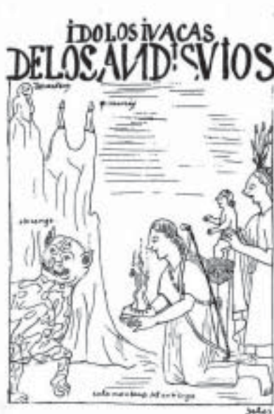
Antisuyu – Huaca