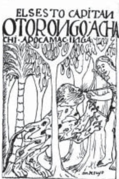
Antisuyu – Sexto Capac