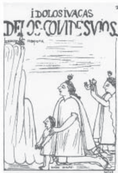
Condesuyu – Huaca