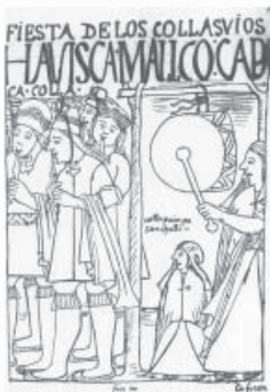
Collasuyu - Festas