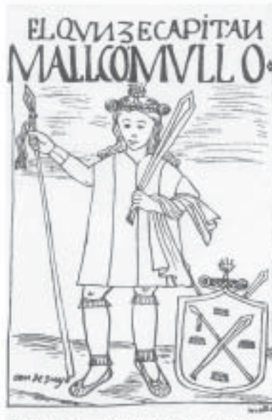
Condesuyu – Décimo Quinto Capac