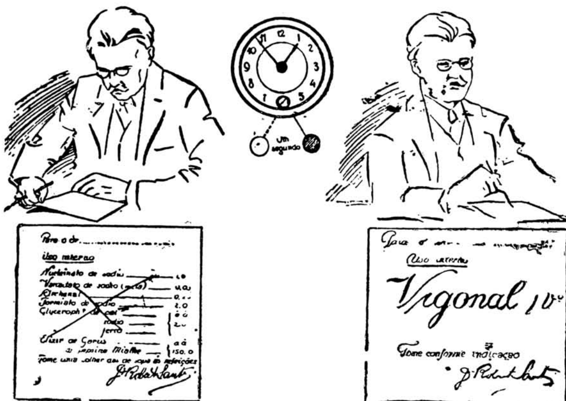
V. S. levará 5 minutos para formular esta receita.