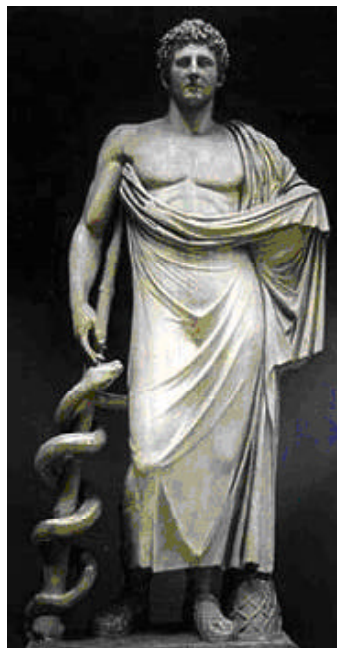
Figura 3. Asclépio, o deus da Medicina. Cópia romana provável de um original grego da autoria de Alcámenes. Data do original: c. -400. Musei Vaticani, Braccio Nuovo.

Como citado anteriormente, o Caduceus , bastão dos arautos que servia de salvo conduto, conferia imunidade ao seu portador em missão de paz. Foi também o presente concedido a Hermes, mensageiro dos deuses e deus do comércio, por seu irmão Apolo e tornou-se, posteriormente, um dos