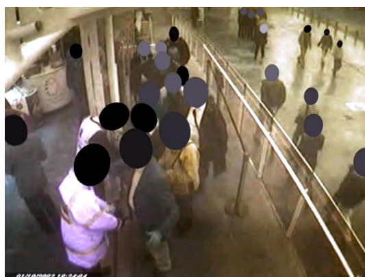
Fotografama de Faceless (2007, 50'), de Manu Luksch

Para os filmes feitos sob a égide de todas as predeterminações, é necessário seguir uma série de indicações técnicas e procedimentos jurídicos para assegurar a obtenção das imagens gravadas pelos circuitos de vigilância. A recuperação desses dados estão sujeitas a complexas questões de direitos autorais. O manifesto apresenta uma linha de fuga das funções tradicionais do circuito de vigilância. O reemprego de imagens, no caso, operativas, recebem outra significação.