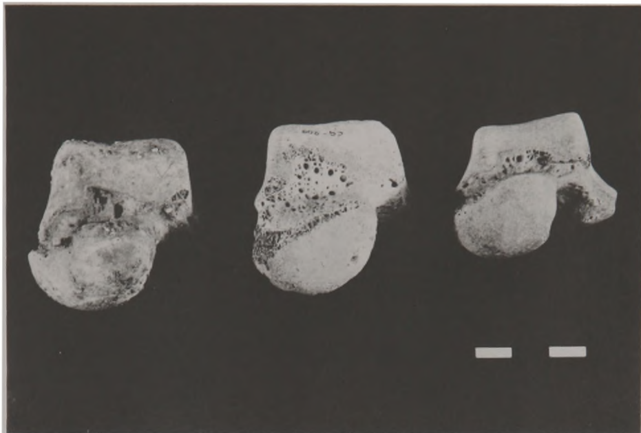
Fig. 5 - Prolongamento anterior da face maleolar medial dos tálus nos variados graus de curvatura.