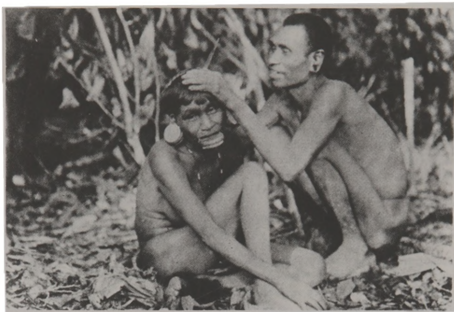
Fig. 8 - Casal de índios Botocudos (Krenak) em posições de lazer.