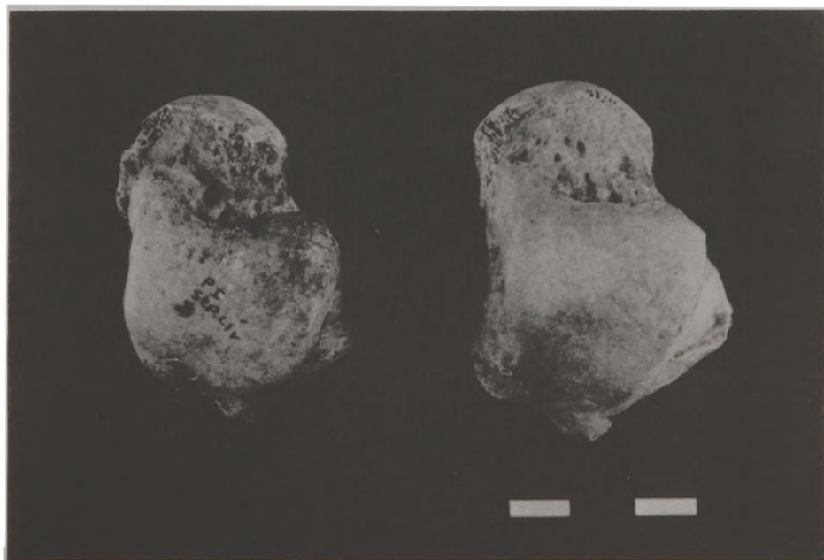
Fig. 6 - Note-se o pronunciado dimorfismo sexual nos tálus.