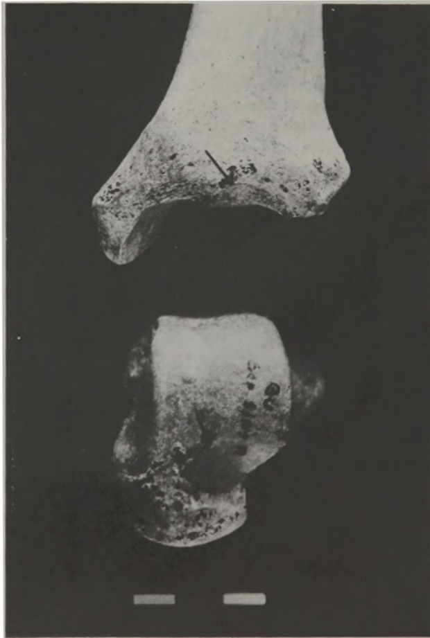
Fig. 2 - Faceta lateral de acocoramento, localizada na margem anterior da epífise distal da tibia e no colo do tálus.

das vezes se apresenta de forma retangular (141 indivíduos - 90,38%), sendo rara a forma triangular (15 indivíduos - 9,62%). A forma retangular, quando muito larga, tem o aspecto de uma "quase-faceta", originária por pressão. Nos indivíduos masculinos, o comprimento desta extensão varia de 3 a 10 mm, com a média de 6,4 mm e nos femininos, de 3 a 9 mm, com a média de 5,4 mm. Considerando-se que o tálus masculino apresenta módulo de valor bem mais elevado (X