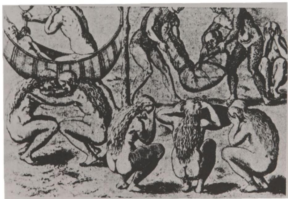
Fig. 9 - Cerimonial funerário de índio tupinambá (segundo DeBrey). Note-se as mulheres em posição de cócoras, pranteando o morto.