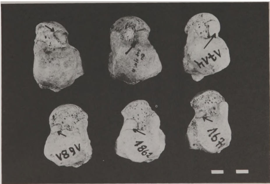
Fig.1 - Diferentes aspectos da faceta lateral de acocoramento no colo do tálus.

Dos 156 indivíduos examinados (99 masculinos - 57 femininos), 22 (14,10%) apresentam curvatura perceptível, 93 (59,61%) moderadamente pronunciada e 41 (26,28%) muito pronunciada. Em 12 indivíduos masculinos a curvatura do tipo perceptível é de 12,12% e em 10 femininos de 17,54%; em 57 masculinos o tipo de curvatura moderadamente pronunciada é de 57,58% e em 36 femininos de 63,16%; em 30 indivíduos masculinos (30,30%) e em 11 femininos (19,30%) o tipo de curvatura é o de muito pronunciada. Inexistem tálus sem curvatura da porção anterior da face maleolar medial. Estes percentuais indicam maior ocorrência de tálus de curvatura moderada em ambos os sexos, sendo a curvatura muito pronunciada de maior ocorrência nos espécimes masculinos.