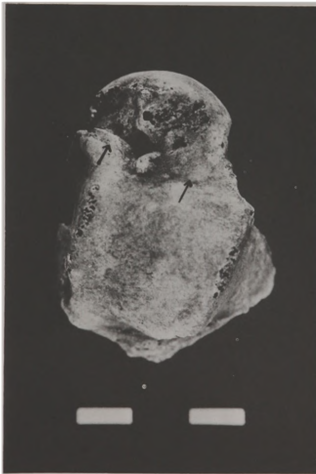
Fig. 3 - Facetas lateral e medial do acorramento no colo do tálus.

nozelo. A extensão medial remodela principalmente a face articular da epífise distal da tíbia. Porém, na presente série, a faceta medial de acorramento, localizada na porção ântero superior da extensão medial do tálus, com sua correspondente na margem anterior da epífise distal da tíbia, está presente em 3 indivíduos, seis ossos (1,92%). Predominantemente, próxima desta extensão observa-se a presença de uma faceta quase distinta sem a sua correspondente na