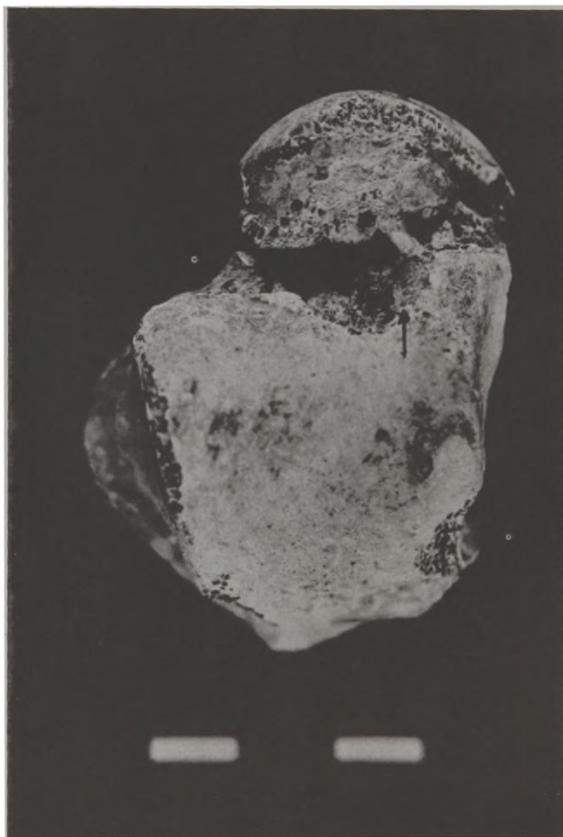
Fig. 4 - Note-se a presença de uma quase-faceta medial, em plano distinto ao da extensão troclear.

A extensão modifica a forma da faceta articular da epífise distal da tíbia e a articulação com este osso ocorre somente no limite extremo