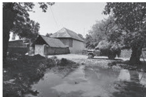
Fig. 4. Casa no vilarejo de Nij, região Gabala. Azerbaijão, 2012.

tantes do lugarejo. As comunidades étnicas da República do Azerbaijão possuem suas próprias organizações religiosas e sociais ocupando-se dos problemas espirituais de seus membros, que recebem apoio do Estado. O registro da comunidade udi-albanesa cristã pelo Comitê Estatal Azerbaijano para as Comunidades Religiosas, no dia 10 de abril de 2003, assumiu um imenso significado espiritual para o povo udi. Em 19 de maio de 2006 realizou-se a cerimônia inaugural e a cerimônias de consagração da igreja udi-albanesa de Santo Eliseu de Tchotari, restaurada em Nij. Ocasão em que foi anunciado que daí em diante seria sempre festejado o dia 19 de maio como o dia do Renascimento da Igreja Albanesa do Azerbaijão. A conservação da língua, da cultura e da herança espiritual udi é considerada como uma pequena, mas irrefutável, parte da história do Azerbaijão, é a missão fixada pelo Centro Nacional para a Cultura e a Civilização “Orayin” e a comunidade cristã udi-albanesa. Promovendo o conhecimento da história e da Cultura udi, preparam a edição de obras literárias e pedagógicas em língua udi e a publicação de coletâneas do folclore e de relatos de autores udis; enfim, mantém laços com os udis do Azerbadjão e os da diáspora udi que vivem fora do território de sua pátria histórica.