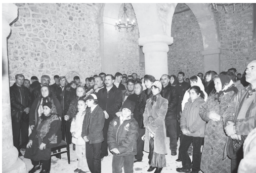
Figs. 13 a-b. Páscoa na Igreja de Santo Eliseu - Nij. Azerbaijão. 2013.

partir da data da cerimônia da restauração da igreja udi Tchotari no dia 19 de maio de 2006 e do registro oficial da comunidade cristã udi-albanesa em 19 de maio de 2003 (fig. 14).