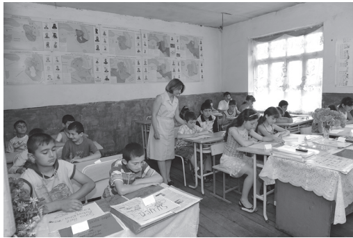
Fig. 6. Lição de língua udi na escola primária de Nij. Azerbaijão, 2013.