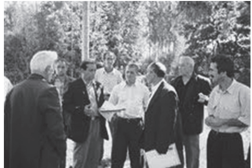
Fig. 14. Ativistas udi-albaneses da comunidade cristã durante uma discussão em abril de 2008. Nij, Azerbaijão

partir da data da cerimônia da restauração da igreja udi Tchotari no dia 19 de maio de 2006 e do registro oficial da comunidade cristã udi-albanesa em 19 de maio de 2003 (fig. 14).