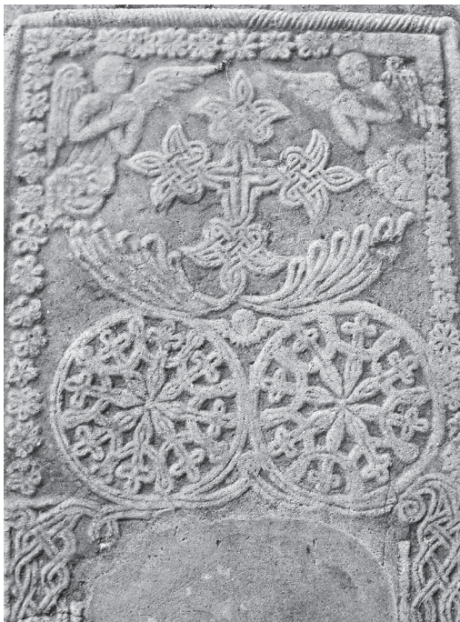
Fig. 2. Lápide sobre o túmulo de um sacerdote (final do século XVII). Entrada sul da Igreja de Santo Eliseu em Nij. Azerbaijão.

Um pequeno grupo dos udis vive na Geórgia, no povoado de Oktomberi (Zinobiani) da região de Kvareli. O resto dos udis vive esporadicamente em algumas grandes cidades da Rússia (Moscou, São Petersburgo, Volgograd, Astrakhan, Ekaterinburgo, Ivanovo etc.) e nas zonas de povoamento da região de Krasnodar, Rostov sobre Don, Volgogrado, Kalouga, Tver e muitas outras. Enfim os encontramos de maneira relativamente reagrupada nas cidades de Shakhta e de Taganrog da região de Rostov. Uma pequena diáspora udi constituída de cerca de setecentas ou oitocentas pessoas vivem no Kazaquistão em Aktau e na Ucrânia em Gorlovka. Alguns udis vivem igualmente de maneira dispersa na França, Estados Unidos, Bielorrússia, Letônia e Ucrânia, assim como em outros países da CEI (Comunidade dos Estados Independentes). Uma organização supranacional envolvendo 11 repúblicas que pertenciam à antiga União Soviética). Segundo os dados do recenseamento de 2002, haveria na Rússia três mil setecentos e vinte e um udis. Estes números foram minimizados porque os udis foram obrigados a deixar suas regiões de povoamento histórico no decorrer do século XX e especifi-