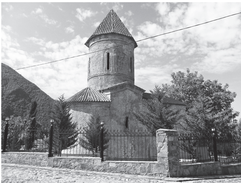
Fig. 9. Igreja de Santo Eliseu na vila de Kish, região de Shaki. Igreja mãe das igrejas orientais (final do século I, início do século II). Kish. Azerbaijão, 2014.

para a língua udi. Nos arredores de Oghuz (Vartashen), o udi ortodoxo Zinovij Silikov construiu o Mosteiro de Santo Eliseu, mas após o decreto do Czar Nicolau I, este mosteiro passou à jurisdição da Igreja Armênia. Com relação aos fatos evocados acima, por iniciativa de intelectuais udis, em 10 de abril de 2003, a comunidade cristã udi-albanesa foi registrada no Comitê Estatal para as Comunidades Religiosas do Azerbaijão. Tal registro é um primeiro passo em direção ao renascimento da Igreja Apostólica Albanesa Autocéfala. Hoje, com a ajuda da Organização Humanitária Norueguesa do Reino da Noruega, a Igreja de Santo Eliseu de Kish (considerada como mãe das igrejas do Cáucaso) foi restaurada. Em 19 de maio de 2006, realizou-se a cerimônia de inauguração e de consagração da Igreja “Tchotari” da cidade de Nij. Também foram iniciados os trabalhos de restauração de uma das igrejas ortodoxas no território do distrito de Oghuz e em breve será concluída a restauração da Igreja “Geyün” de Nij e em todas estas igrejas os ofícios religiosos serão assegurados na língua vernácula pelos membros da comunidade udi. (fig. 9)