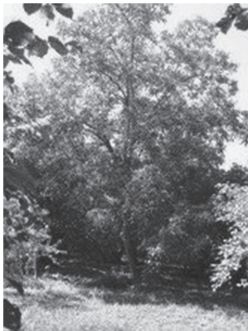
Fig. 3. Bosques de nogueiras e aveleiras na região de Nij. Foto do autor, 2012.

O acontecimento mais importante da atualidade na vida dos udis foi o encontro cordial e respeitoso dos habitantes de Nij, cuja história é mais de duas vezes milenar, com o presidente do Azerbaijão, Ilham Aliyev e sua esposa Mehriban Aliyeva, em 18 de agosto de 2005 (fig. 5). Ilham Aliyev pronunciou um discurso diante dos habi-