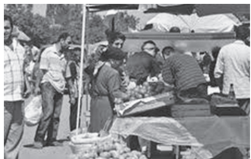
Fig. 11. Feira dominical de produtos alimentícios em Yakmarka, proximidades de Nij. Azerbaijão, 2010.

As bebidas são: cozimento de bagas, frutos secos, erva e de polpas das nozes verdes, cachaa de abrunho, de cornisololo, de ameixa, da amora madura, e do mosto da uva ( tchetcha ). Não se deve esquecer da grande seleção de vinhos elaborados a partir de espécies de uva locais como a shalab , figombal , merendi , matsitul , maintul ou importados como o mousquet e o moldovanka .