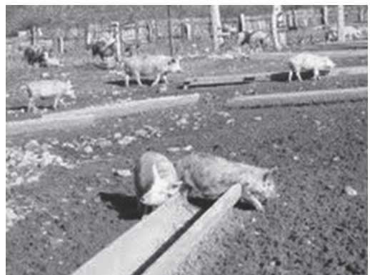
Fig. 10. Fazenda com criatório de porcos. Região de Nij. Azerbaijão, 2012.

No território densamente povoado pelos udi, situado nos contrafortes das montanhas e nos vales, a criação de animais domésticos foi sempre muito desenvolvida. Sendo prioritária a agricultura, os udis, consideravam a criação de animais como um ramo secundário e auxiliar da economia. Entretanto, na pecuária a criação bovina e suína ocupam o primeiro lugar. Sendo que esta última desempenha na economia dos udis uma atividade comercial de primeira ordem (fig. 10). Na primavera deslocavam-se a vara de porcos, as tropas de gado e cavalos para as pastagens situadas no sopé das montanhas e no outono eram reconduzidos aos estábulos. Da pecuária os udis retiram para a alimentação as carnes bovina e suína, laticínios como a manteiga, queijo de ovelha ( labrynza ), l'ayran