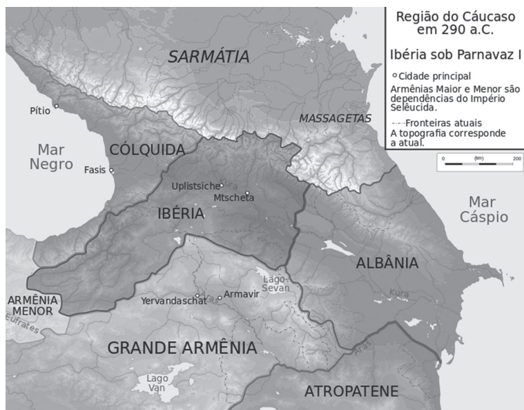
Fig. 1. Mapa da antiga Albânia do Cáucaso.

parte das vinte e seis tribos albanesas que criaram o Reino da Albânia Caucásica (século III a. C. ao século VII d.C.) e são antepassados dos povos azerbaijanos modernos. Desde então foram editados trezentos trabalhos sobre a antropologia (Arutinov 1905: 93-94), língua (Gukasyan 1974: 3-34), religião (Huseynov 2008: 22-25), filologia (Gukasyan 1974: 17-19; Ganenkov 2008: 3-77), etnografia (Bezhanov 1892: 219-260; Javadov; Huseynov 1999: 199-228), história (Javadov; Huseynov 1999: 18-86), origens (Melikov 2002: 78-81), cultura (Javadov; Huseynov 1999: 87-95), tradições e costumes (Kechaari 2001: 3; Mobili: 26, 29) dos udi-albaneses. Os dados acumulados testemunham formalmente que os udis são os mais antigos habitantes do Cáucaso assinalados no espaço histórico-cultural do Azerbaijão. (fig. 2)