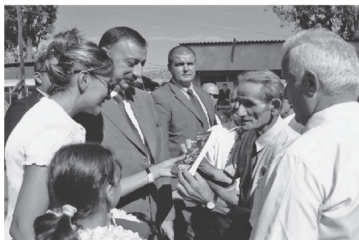
Fig. 5. Visita oficial do Presidente da República do Azerbaijão a Nij, um dos principais núcleos urbanos da população udi, em 18 de agosto de 2005.

tantes do lugarejo. As comunidades étnicas da República do Azerbaijão possuem suas próprias organizações religiosas e sociais ocupando-se dos problemas espirituais de seus membros, que recebem apoio do Estado. O registro da comunidade udi-albanesa cristã pelo Comitê Estatal Azerbaijano para as Comunidades Religiosas, no dia 10 de abril de 2003, assumiu um imenso significado espiritual para o povo udi. Em 19 de maio de 2006 realizou-se a cerimônia inaugural e a cerimônias de consagração da igreja udi-albanesa de Santo Eliseu de Tchotari, restaurada em Nij. Ocasão em que foi anunciado que daí em diante seria sempre festejado o dia 19 de maio como o dia do Renascimento da Igreja Albanesa do Azerbaijão. A conservação da língua, da cultura e da herança espiritual udi é considerada como uma pequena, mas irrefutável, parte da história do Azerbaijão, é a missão fixada pelo Centro Nacional para a Cultura e a Civilização “Orayin” e a comunidade cristã udi-albanesa. Promovendo o conhecimento da história e da Cultura udi, preparam a edição de obras literárias e pedagógicas em língua udi e a publicação de coletâneas do folclore e de relatos de autores udis; enfim, mantém laços com os udis do Azerbadjão e os da diáspora udi que vivem fora do território de sua pátria histórica.