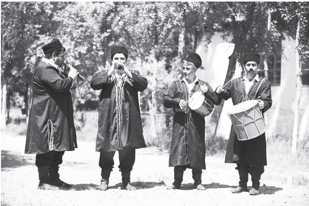
Fig. 12. Grupo musical udi. Nij, 2013.

Em meados do século XX, os vestuários tradicionais dos udis desaparecem, despojados pelos vestuários contemporâneos comuns. O udis de hoje usam vestuários semelhantes em todos os pontos àqueles comuns usados de maneira habitual, segundo as exigências da moda, da estação ou da temperatura. (fig. 12)