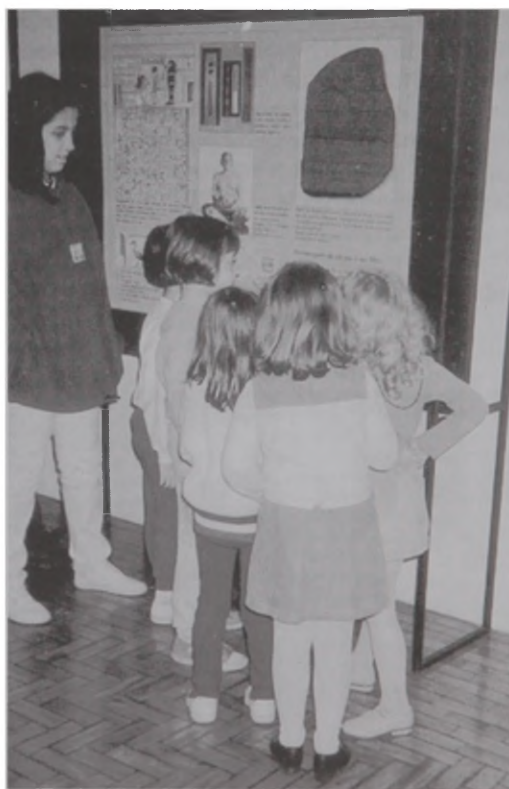
Fig. 2 – Crianças na exposição durante o “Ateliê da Escrita” realizado nas férias.