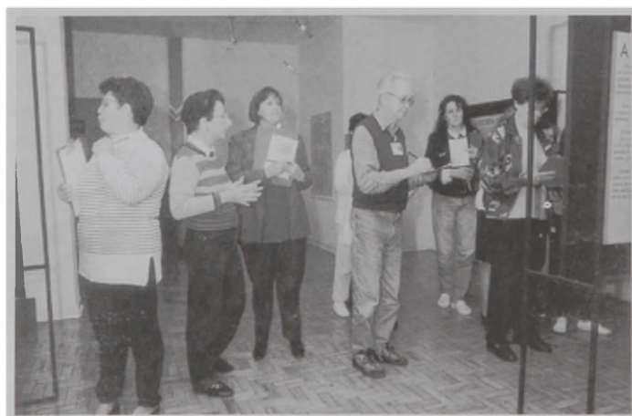
Fig. 3 – Grupo da Terceira Idade na exposição.

Finalmente, a terceira etapa, foi uma oficina de desenho, em que utilizaram papel Canson e guache. Os participantes passaram para este papel os signos que haviam escolhido.