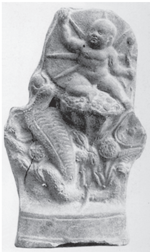
Fig. 9 – Harpócrates surgindo de uma flor de lótus (Dunand 1990: 95, fig. 210).

Vários animais, importantes quanto às questões relativas à potência sexual ou à fertilidade, aparecem representados com Harpócrates. Em geral, estes animais, como o ganso (Fig. 10) e o carneiro (Fig. 11), poderiam estar relacionados tanto com divindades egípcias quanto gregas. No Egito, o carneiro aparece ligado às divindades associadas a algum mito cosmogônico. É o caso, por exemplo, de Âmon, de Ptah e de Khnum. Este último era um deus criador, da Ilha de Elefantina, representado com cabeça de carneiro. Deus oleiro, havia modelado em seu torno as formas da criação, os seres vivos, os vegetais e também as formas geográficas do mundo. Também estava associado com a cheia do Nilo, sendo o guardião das fontes deste rio. Já Âmon era um deus tebano, que formava a tríade familiar com Mut e Khonsu. Poderia ser representado com cabeça de carneiro. Seu nome significa “o oculto”, porque sua identidade