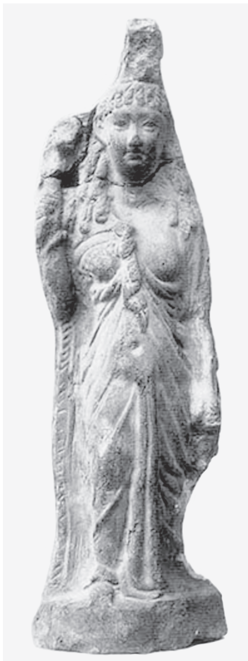
Fig. 1 – Isis em pé (Dunand 1990: 148-149, fig. 396).

tinham a função de propiciar ao morto, de ambos os sexos, um renascimento para uma nova vida. Provavelmente, estavam associadas à deusa Háthor.