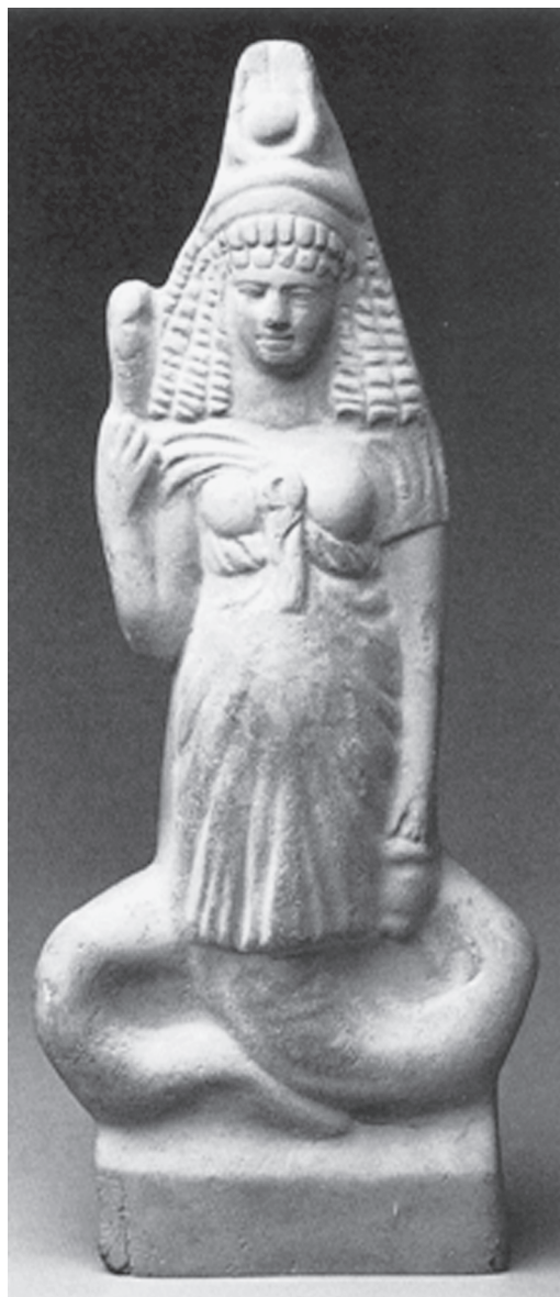
Fig. 3 – Ísis-Thermuthis (Ewigleben; Grumbkow 1991: 58, fig. 39).

procedimento também era comum quando do aparecimento do novo Ápis, touro sagrado de Mênfis. Antes de ser apresentado oficialmente à população, o recém-nascido recebia a visitação das mulheres, que erguiam as vestes diante dele em um ritual de fertilidade (Diodoro, I, 85, 3). Segundo Montserrat (1996: 168-69), a exposição do novo Ápis às mulheres, quando este estava ainda vulnerá-