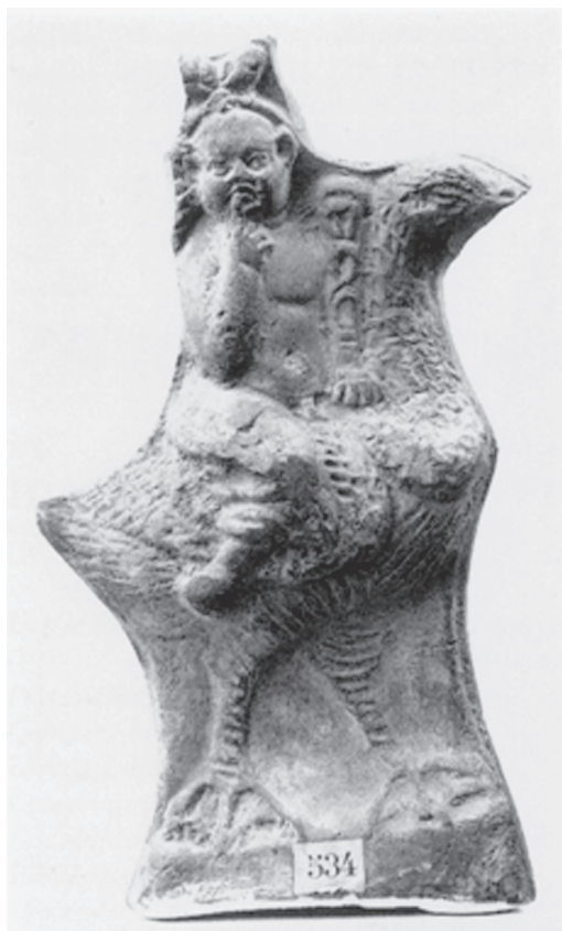
Fig. 10 – Harpócrates montado sobre um ganso (Dunand 1990: 89-90, fig. 191).

Vários animais, importantes quanto às questões relativas à potência sexual ou à fertilidade, aparecem representados com Harpócrates. Em geral, estes animais, como o ganso (Fig. 10) e o carneiro (Fig. 11), poderiam estar relacionados tanto com divindades egípcias quanto gregas. No Egito, o carneiro aparece ligado às divindades associadas a algum mito cosmogônico. É o caso, por exemplo, de Âmon, de Ptah e de Khnum. Este último era um deus criador, da Ilha de Elefantina, representado com cabeça de carneiro. Deus oleiro, havia modelado em seu torno as formas da criação, os seres vivos, os vegetais e também as formas geográficas do mundo. Também estava associado com a cheia do Nilo, sendo o guardião das fontes deste rio. Já Âmon era um deus tebano, que formava a tríade familiar com Mut e Khonsu. Poderia ser representado com cabeça de carneiro. Seu nome significa “o oculto”, porque sua identidade