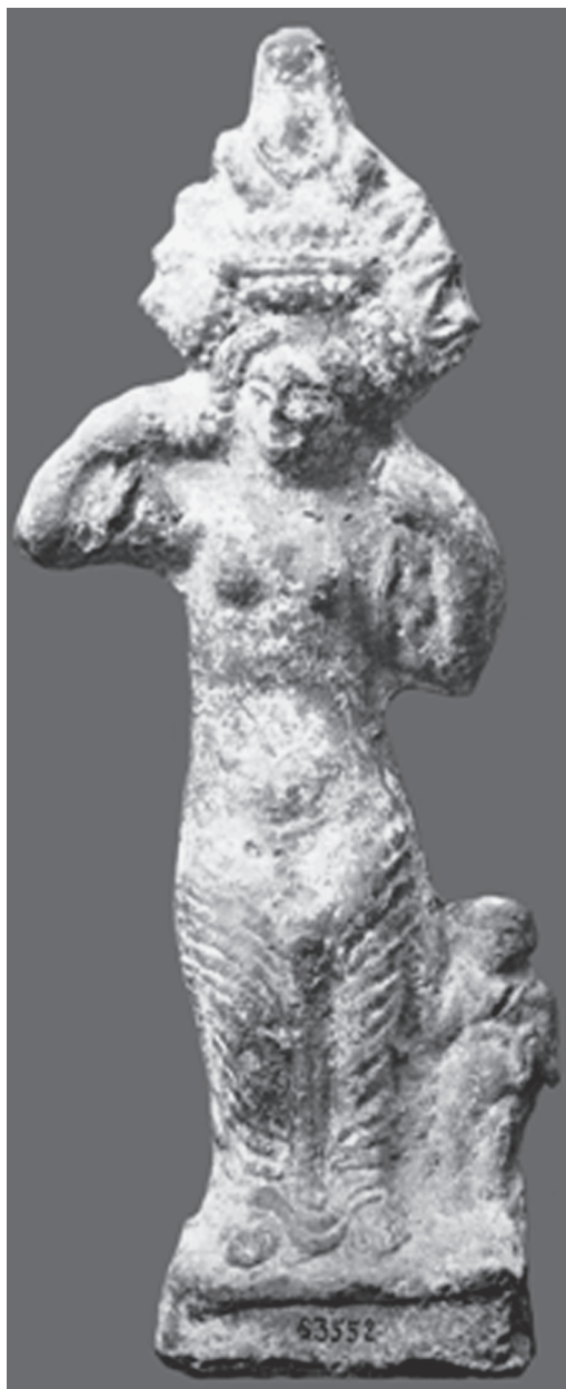
Fig. 6 – Ísis-Afrodite anadiômena (Dunand 1979: 186 pr. XXXVI, fig. 59).

vel pela sua pouca idade, poderia ter uma função apotropaica. O mesmo sentido teria o gesto da deusa Háthor diante de seu pai Rê, nos episódios da “Contenda entre Hórus e Seth”. Rê estava zangado e de mau humor. Para restaurar sua boa vontade, Háthor lhe mostra seus genitais.