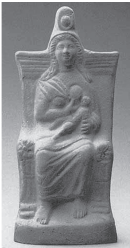
Fig. 2 – Isis-Lactans (Ewigleben; Grumbkow 1991: 55, fig. 33).

tinham a função de propiciar ao morto, de ambos os sexos, um renascimento para uma nova vida. Provavelmente, estavam associadas à deusa Háthor.