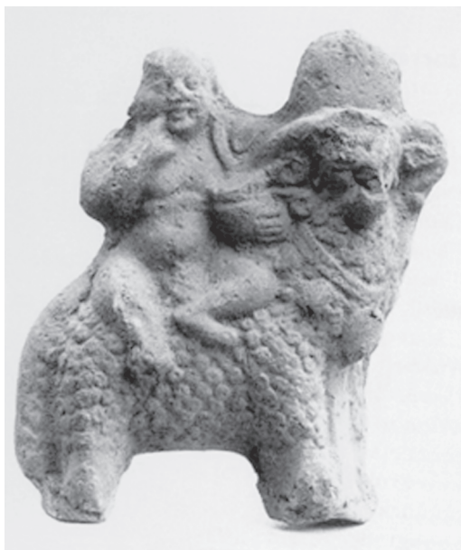
Fig. 11 – Harpócrates montado sobre um carneiro (Dumand 1990: 92, fig. 198).

pelos gregos a Hércules. Deus demiurgo, seu nome significa “aquele que está sobre seu lago”, uma referência às águas do oceano primordial. Várias divindades ovinas existiam no Egito e muitas delas eram consideradas como sendo o ba de Rê ou de Osíris, porque o som onomatopaico da palavra egípcia para carneiro era semelhante à palavra o ba , que designa a “alma” do morto, seu espírito móvel. É o caso, por exemplo, do carneiro da cidade de Mendes, considerado a manifestação do ba de Osíris.