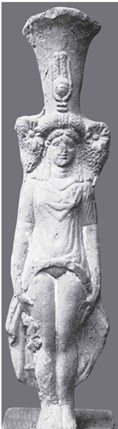
Fig. 5 – Ísis-Afrodite anasirmena (Dunand 1979: 186-187, pr. XXXVII, fig. 60) .