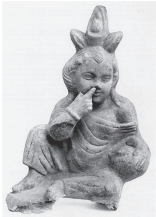
Fig. 7 – Harpócrates com pote (Dunand 1990: 69, fig. 126).

comida, a Harpocrateia , na qual, segundo Frankfurter (1998: 54), provavelmente, eram distribuídos doces para as crianças. Além deste vaso oval, Harpócrates também era representado segurando uma cornucópia 17 (Fig. 8). Ambos são símbolos da abundância e da prosperidade.