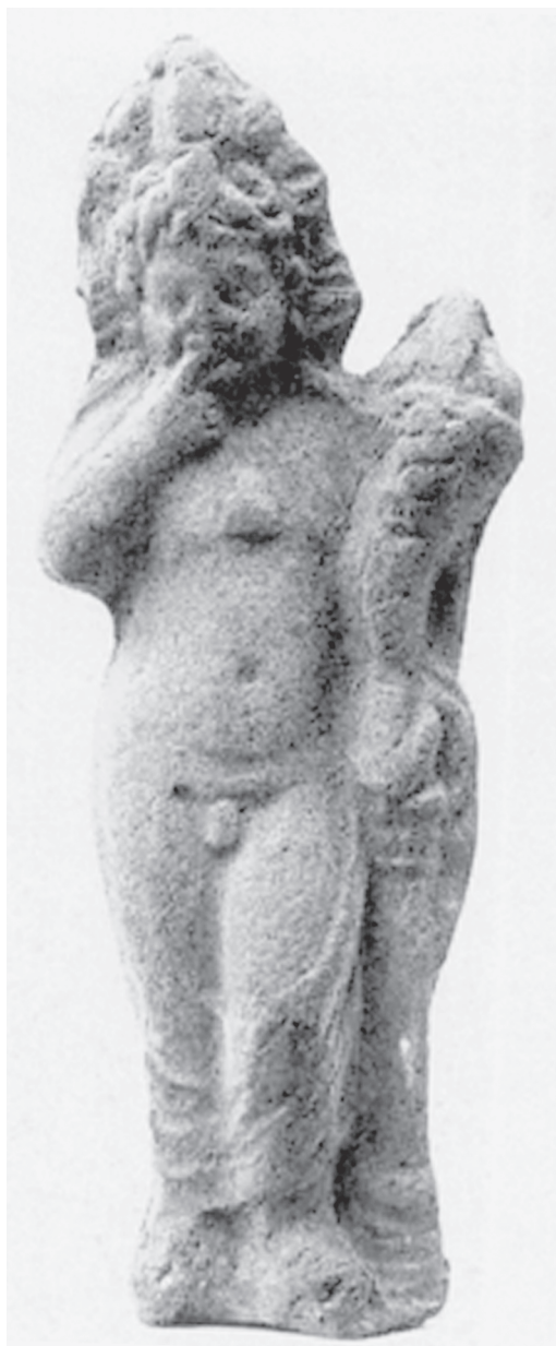
Fig. 8 – Harpócrates com cornucópia (Dunand 1990: 78, fig. 155).

falo ereto com a mão esquerda e tendo a mão direita erguida segurando um açoit. Às vezes, Min era assimilado a Hórus, sendo chamado de filho de Ísis. Já Bés era um deus benéfico, protetor da casa, da família e das crianças. Deus-anão com características faciais grotescas e com uma língua protuberante,